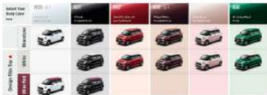
View Model 2024