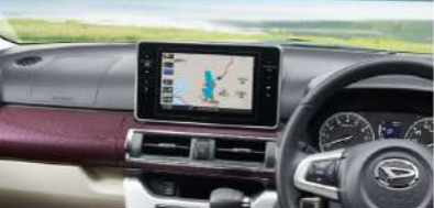
※ナビはオプションで装着可能。ナビはナビ専用ディスプレイに接続して使用可能。ナビ専用ディスプレイは別途販売。ナビ専用ディスプレイはナビ専用ディスプレイに接続して使用可能。ナビ専用ディスプレイは別途販売。ナビ専用ディスプレイはナビ専用ディスプレイに接続して使用可能。ナビ専用ディスプレイは別途販売。