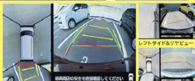
トップ&リヤビュー