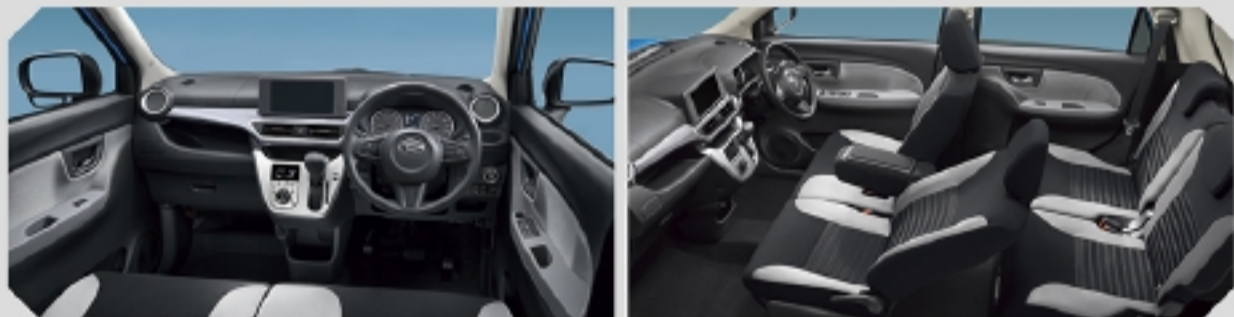
Photo:アクティバ X"リミテッド SA III"(2WD)。ボディカラーはスプラッシュブルーメタリック(B80)。デザインフィルムトップ(クリスタル調/ホワイト)はメーカーオプションで43,200円高(消費税込み)。