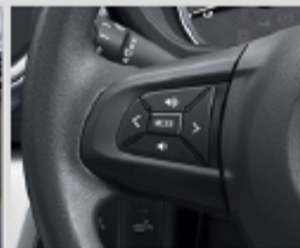
ステアリングスイッチ