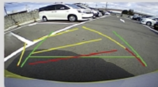
バックモニター(ステアリング運動ガイド線表示)