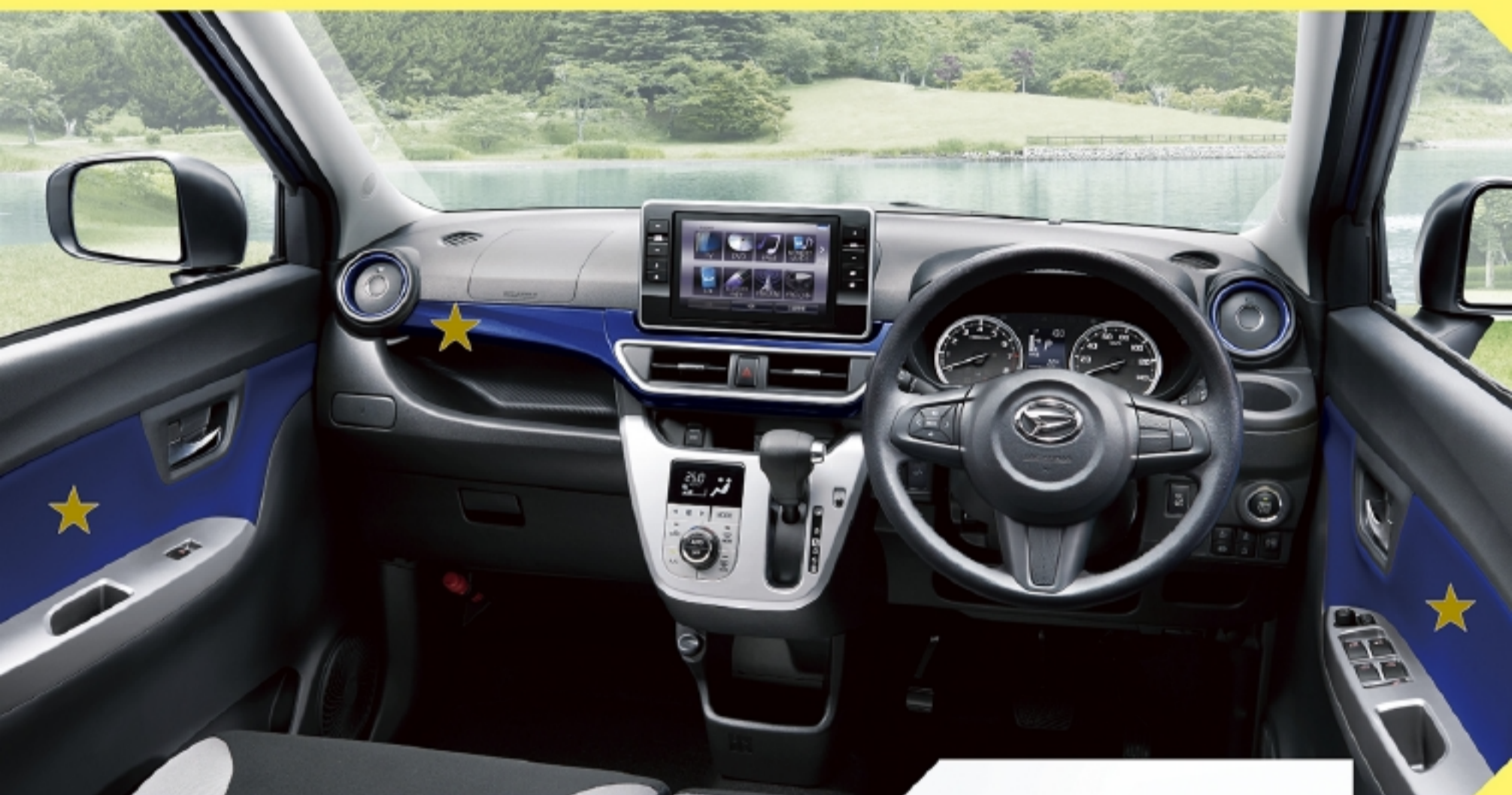
Photo:アクティバ G*VS SA II*(2WD)。ボディカラーのディープブルークリスタルマイカ(B79)はメーカーオプションで21,600円高(消費税込み)。デザインフィルムトップ(カーボン調/ブラック)はメーカーオプションで21,600円高(消費税込み)。8インチ スタンダード メモリーナビ[2019モデル]はディーラーオプションで(標準プランA)188,006円高(標準取付費・消費税込み)。最新の仕様・設定については、販売会社におたずねください。 ■ステアリングホイールはG*VS SA II*はウレタン(メッキオーナメント付)です。Gターボ*VS SA II*は革巻(メッキオーナメント・シルバー加飾付)となります。 ■カップホルダーシンボル照明(助手席)は、Gターボ*VS SA II*に標準装備。G*VS SA II*には装着されません。