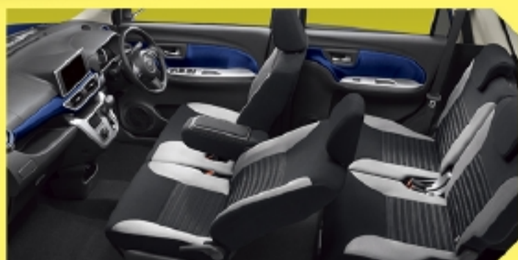
Photo: アクティバ G*VS SA III(2WD)。ボディカラーのディープブルークリスタルマイカ(B79)はメーカーオプションで21,600円高(消費税込み)。デザインフィルムトップ(カーボン調/ブラック)はメーカーオプションで21,600円高(消費税込み)。 ■ステアリングホイールはG*VS SA IIIはウレタン(メッキオーナメント付)です。Gターボ*VS SA IIIは革巻(メッキオーナメント・シルバードア飾付)となります。 ■カップホルダーシンボル照明(助手席)は、Gターボ*VS SA IIIに標準装備。G*VS SA IIIには装着されません。