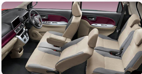
Photo:G*VS SA III*(2WD).ボディカラーはファイアークォーツレッドメタリック(R67)。デザインフィルムトップ(クリスタル調/ホワイト)はメーカーオプションで44,000円高(消費税込み)。■ステアリングホイールはG*VS SA III*はウレタン(メッキオーナメント付)です。Gターボ*VS SA III*は本革巻(メッキオーナメント・シルバー加飾付)となります。■カップホルダー・シンボル照明(助手席)は、Gターボ*VS SA III*に標準装備。G*VS SA III*には装着されません。