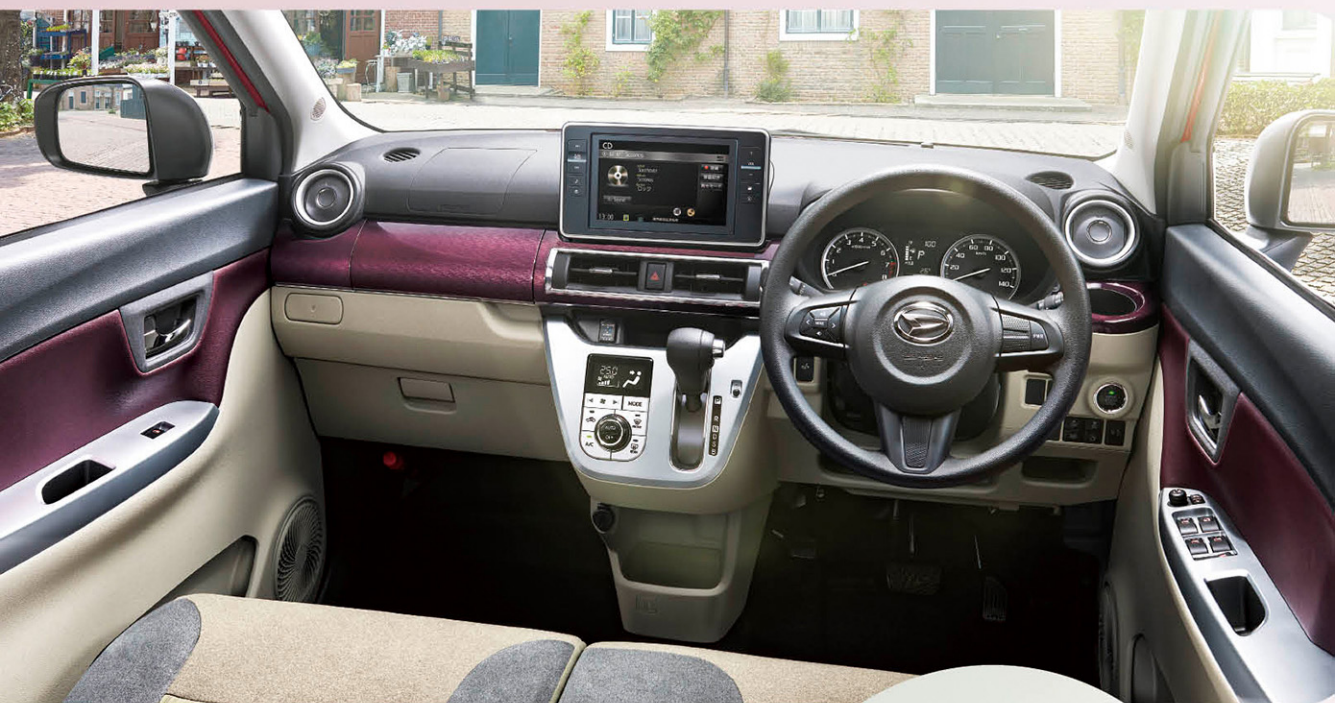
Photo:G*VS SA III*(2WD)。ボディカラーはファイアーコートレッドメタリック(R67)。デザインフィルムトップ(クリスタル調/ホワイト)はメーカーオプションで44,000円高(消費税込み)。8インチスタンダードメモリーナビ[2022モデル]はディーラーオプションで(標準プランA)191,488円高(標準取付費・消費税込み)。最新の仕様・設定については、販売会社におたずねください。■ステアリングホイールはG*VS SA III*はウレタン(メッキオーナーメント付)です。Gターボ*VS SA III*は本革巻(メッキオーナーメント・シルバー加飾付)となります。■カップホルダー・シンボル照明(助手席)は、Gターボ*VS SA III*に標準装備。G*VS SA III*には装着されません。