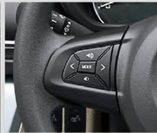
ステアリングスイッチ