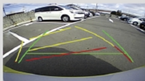
バックモニター(ステアリング連動ガイド線表示)