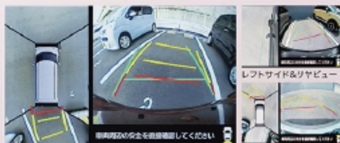
トップ&リヤビュー