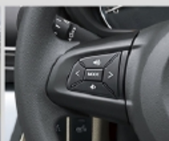
ステアリングスイッチ