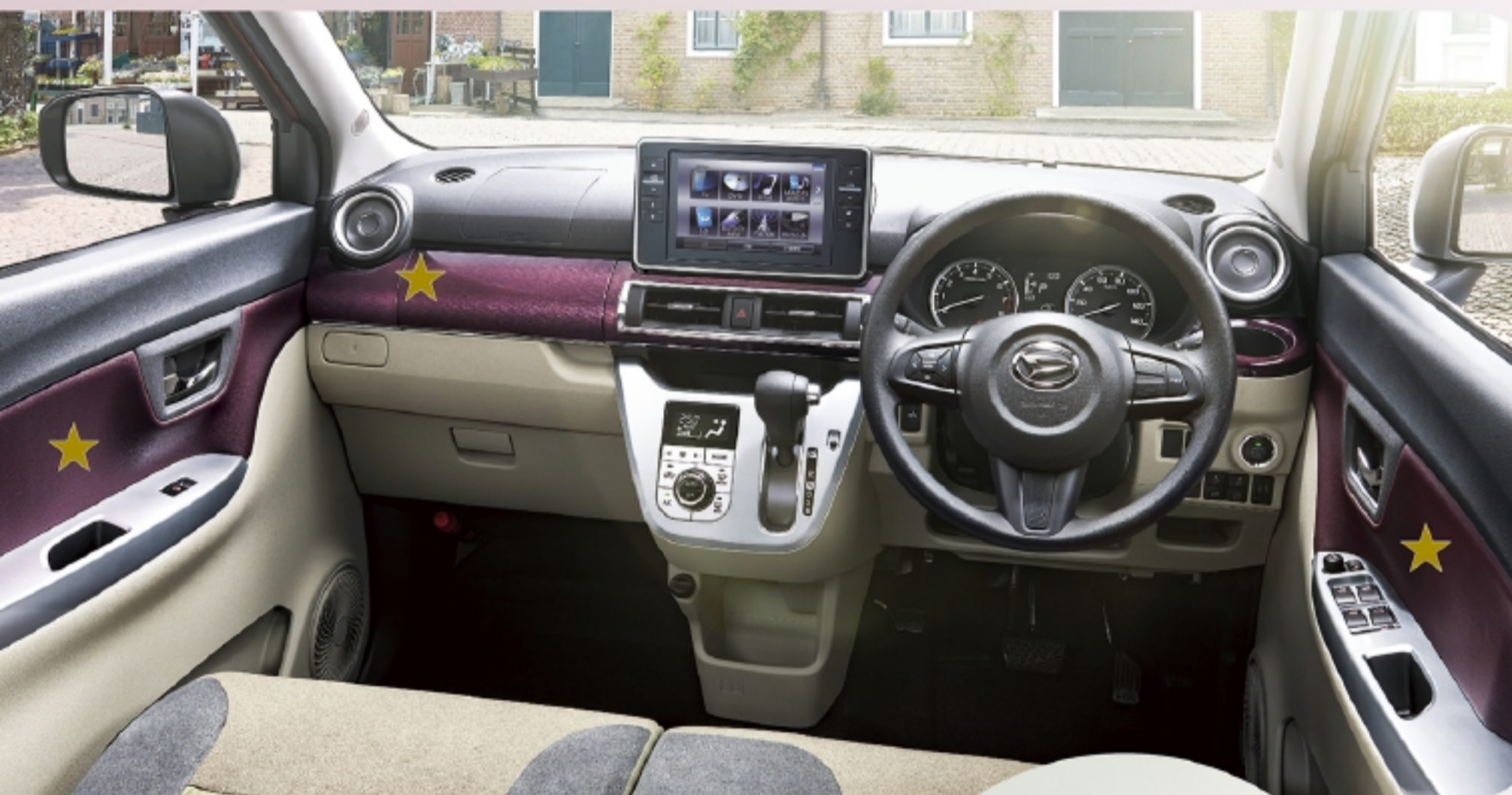
Photo:スタイル G*VS SA III*(2WD)。ボディカラーはファイアーコーズレッドメタリック(R67)。デザインフィルムトップ(クリスタル調/ホワイト)はメーカーオプションで43,200円高(消費税込み)。8インチ スタンダード メモリーナビ(2019モデル)はディーラーオプションで(標準プランA)188,006円高(標準取付費・消費税込み)。最新の仕様・設定については、販売会社におたずねください。■ステアリングホイールはG*VS SA III*はウレタン(メッキオーナメント付)です。Gターボ*VS SA III*は革巻(メッキオーナメント・シルバー加飾付)となります。■カップホルダーシンボル照明(助手席)は、Gターボ*VS SA III*に標準装備、G*VS SA III*には装着されません。