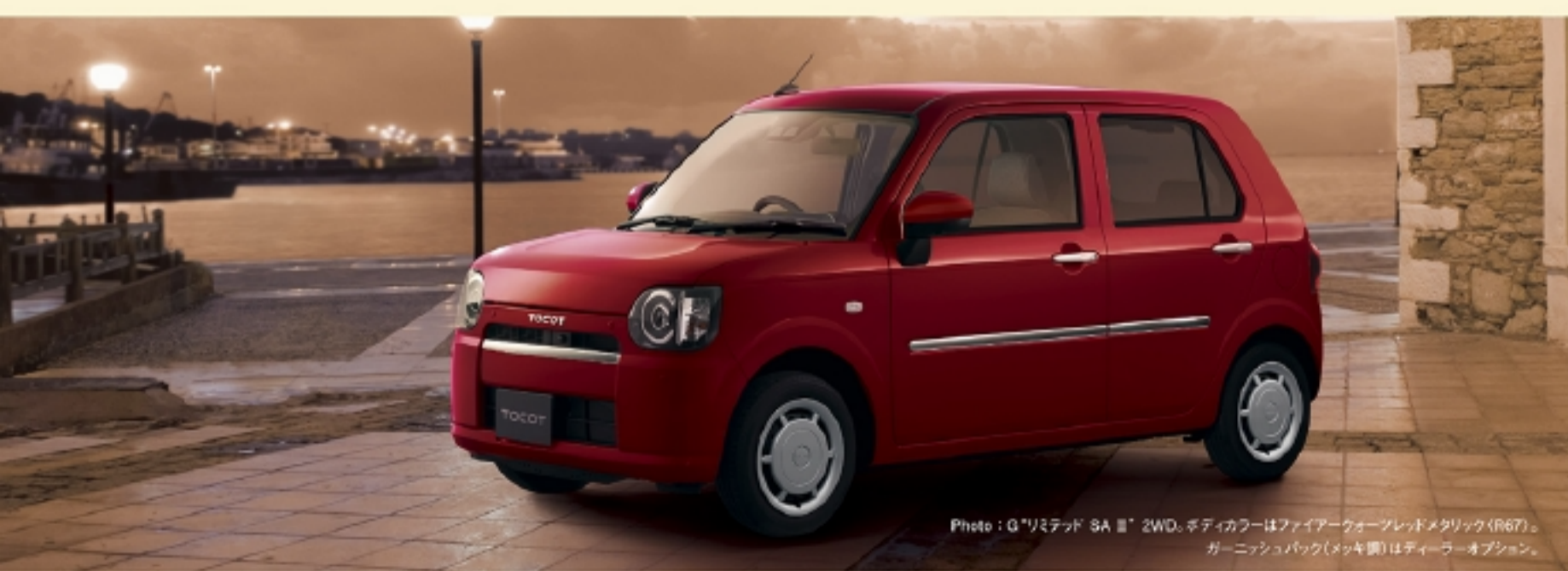
Photo: G*リミテッド SA III* 2WD。ボディカラーはファイアーコーブレッドメタリック（R67）。 ガーニッシュパック（メッキ調）はディーラーオプション。

注意を防止したり、悪天 に応じてブレーキペダル システムが作動しない、また ■作動条件下であって お問い合わせください。