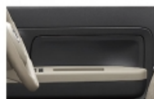
ドアトリム（材質ブラック）