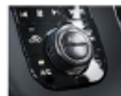
オートエアコン （プッシュ式）