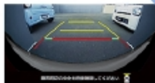
フロントワイドビュー