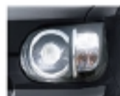
Bi-Angle LEDヘッドランプ （マニュアル レベリング機能付）