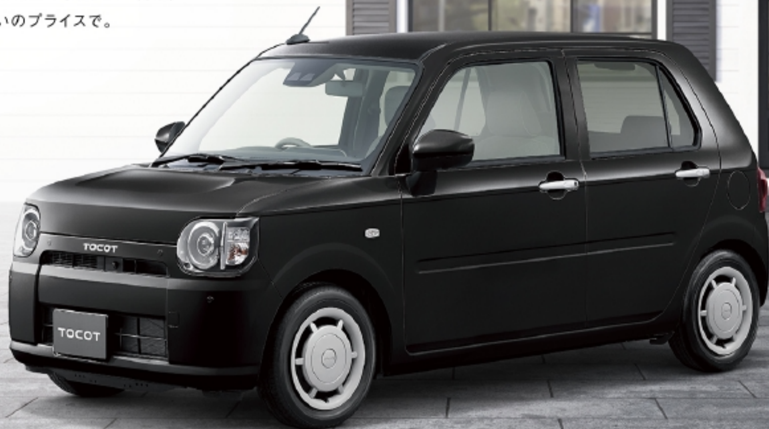
Photo: G o リミテッド SA III o 2WD、ボディカラー：ブラックマイカメタリック(X07) 表紙Photo: G o リミテッド SA III o 2WD、ボディカラー：サニーデューブルーメタリック(B04) ワイドスタンダードメモリーナビ(2019モデル)はディーラーオプション、最新仕様・設定については、販売会社におたずねください。

乗る人にやさしく、乗るたびに心地よく。 安心と使いやすさをしっかり備え、 気がきく装備もたくさんそろった一台を、 うれしさいっぱいのプライスで。