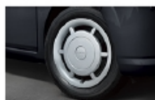
14インチ フルホイールキャップ （TOCOT）アルファベットエンブレム付