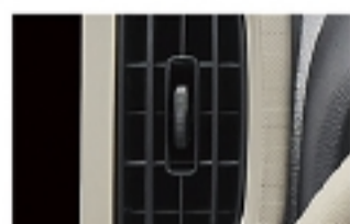
エアコンレジスターノブ （材質ブラック）