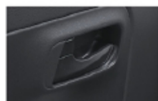
インナードアハンドル （材質ブラック）