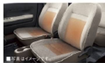
シートヒーター部