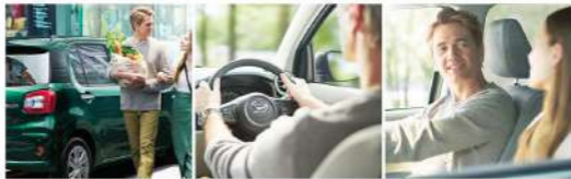
Photo: 3Dレポート SA 3 i-GNCX. 本記事は、本誌「3Dレポート」の取材に基づき、 編集に協力したディーラーの取材に基づき、2021年10月現在の最新情報を掲載しています。最新情報は本誌の最新号をご覧ください。 ■写真は撮影時の状況と異なる場合があります。掲載の車は任意のモデルではありません。 ■写真は撮影時の状況と異なる場合があります。掲載の車は任意のモデルではありません。 ■写真は撮影時の状況と異なる場合があります。掲載の車は任意のモデルではありません。