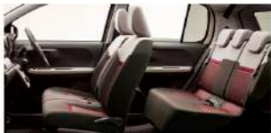
Photo STYLE*SA III (2WD), ボディカラーは6カラー（2WD）×17インチルーチーシェアホイック（120）【税込】はメーカーオプションで55,000円増（消費税込み）。