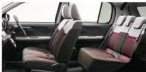
Photo STYLE*SA Ⅲ 2WD, メーカーオプションで165,000円（消費税別） Photo STYLE*SA Ⅲ 4WD, メーカーオプションで165,000円（消費税別）