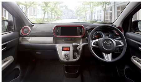
Photo:STYLE "ホワイトリミテッドSA E" (2WD)、ボディカラーはホワイト (W09) ×ジューシーピンクメタリック (R73) [XG7]。 ■写真は機能説明のためにボディの一部を切取したカットモデルです。