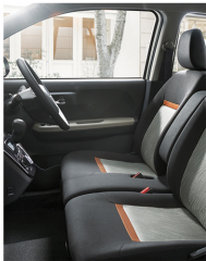
Photo:STYLE「ブラックリミテッドSA Ⅱ」(2WD)、ボディカラーのブラックマイカメタリック (X07) ×パールホワイトⅢ (W24) [X99]はメーカーオプション。 ■写真は機能説明のためにボディの一部を切断了したカットモデルです。