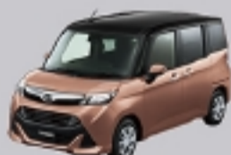
ブラックマイカメタリック(X07)× ブリリアントカッパー クリスタルマイカ(T33) [XG2]*2

カスタムでしか選べない 2トーンカラーを装うチャンス (特別設定メーカーオプション)。