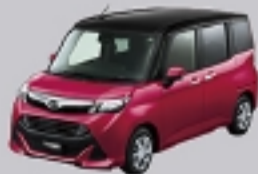
ブラックマイカメタリック(X07)× マゼンタベリーマイカ メタリック(R72) [XE2]*3