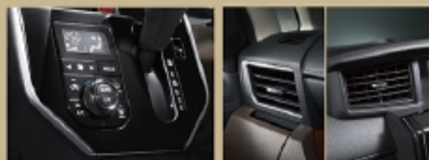
ピアノブラック塗装センタークラスターパネル(シルバー加飾付) / ピアノブラックオートエアコンパネル