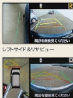
トップ&フロントビュー

車両の前後左右に搭載した4つのカメラから取り込んだ映像を合成し、クルマを真上から見ているような映像をTFTカラーマルチインフォメーションディスプレイに表示。運転席から確認しにくい車両周囲の状況を把握できます。