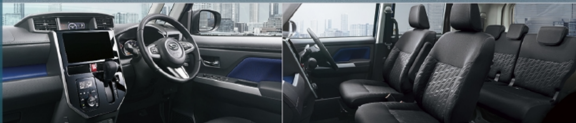
Photo:カスタムG“リミテッドSA III”2WD。ボディカラーのブラックマイカメトリック(X07)×レーザーブルークリスタルシャイン(B82)[XG3]はメーカーオプションで75,600円高(消費税込み)。