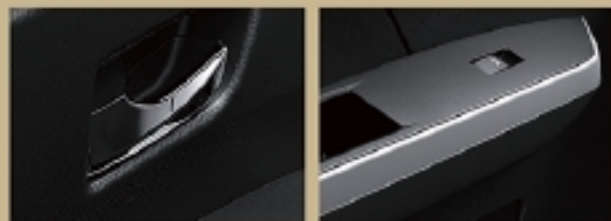
メッキインナードアハンドル / シルバー加飾付ドアトリム