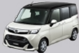
ブラックマイカメタリック(X07)× パールホワイトII(W24) [X99]*2

■カスタムG"リミテッドSA III"は通常メーカーオプション設定となります。■セトーンボディカラーも設定しています。詳しくは巻末をご覧ください。 *2.メーカー希望オプション価格は75,600円(消費税抜き70,000円)。*3.メーカー希望オプション価格は54,000円(消費税抜き50,000円)。