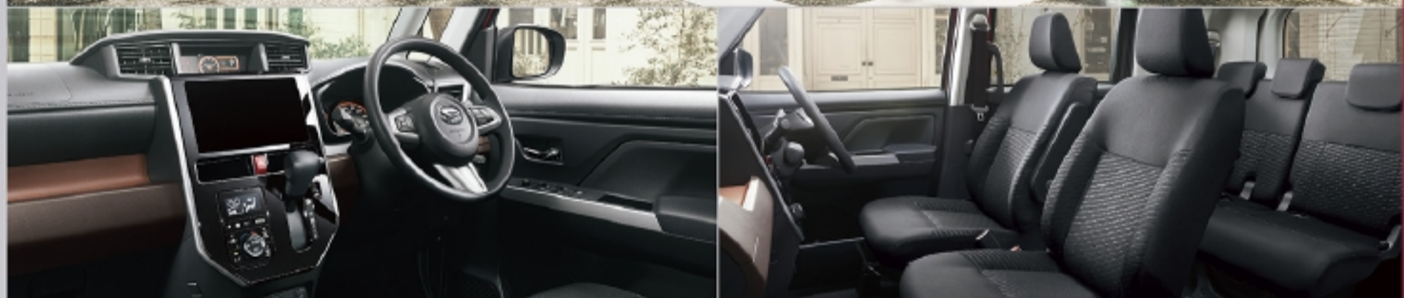
Photo: G"リミテッドSA III" 2WD。ボディカラーのブラックマイカメタリック(X07)×ファイアーキューツレッドメタリック(R67) [X96]はメーカーオプションで54,000円高(消費税込み)。