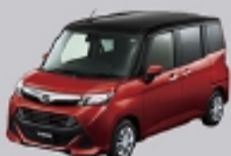
ブラックマイカメタリック(X07)× ファイアーキューツレッド メタリック(R67) [X96]*3