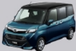
ブラックマイカメタリック(X07)× レーザーブルークリスタルシャイン (B82) [XG3]*2