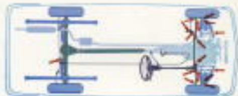
マツダダイセマチックオートクラッチ

マシンの各ジョイント、駆動ブレーキの駆動部への潤滑（グリスアップ）は不要です。お任せのメンテナンスに頼られるファミリーカーです。手まわりの少ないよう配慮しました。