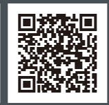
データインフォメーション