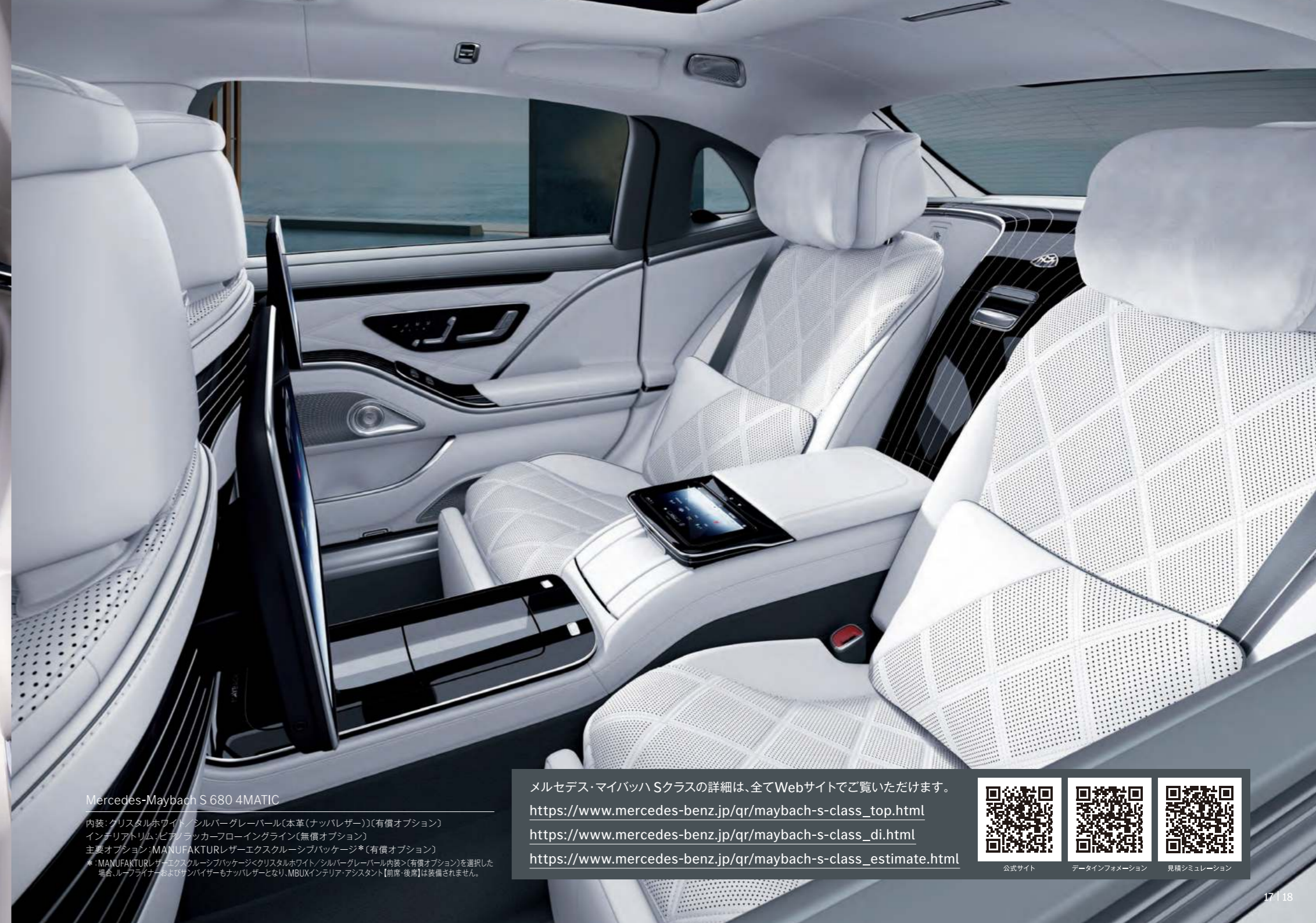
Mercedes-Maybach S 680 4MATIC

※写真の仕様・装備は、日本仕様と異なる場合があります。また、半導体供給不足に伴う生産制約によって、仕様・装備・メーカー希望小売価格が変更になる場合があります。選択できるオプションにつきましては、事前にメルセデス・ベンツ正規販売店にお問い合わせください。