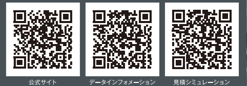
公式サイト データインフォメーション 見積シミュレーション

メルセデス・マイバッハ Sクラスの詳細は、全てWebサイトでご覧いただけます。 https://www.mercedes-benz.jp/qr/maybach-s-class_top.html https://www.mercedes-benz.jp/qr/maybach-s-class_di.html https://www.mercedes-benz.jp/qr/maybach-s-class_estimate.html