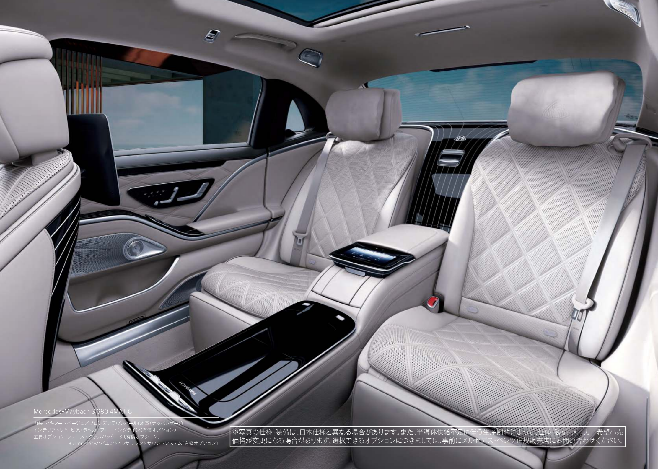
Mercedes-Maybach S 680 4MATIC

内装: マキアートベージュ/ブロンズブラウンパール(本革(ナッパレザー)) インテリアトリム: ビアノラッカーフローイングライン(有償オプション) 主要オプション: ファーストクラスパッケージ(有償オプション) Burmester®ハイエンド4Dサラウンドサウンドシステム(有償オプション)