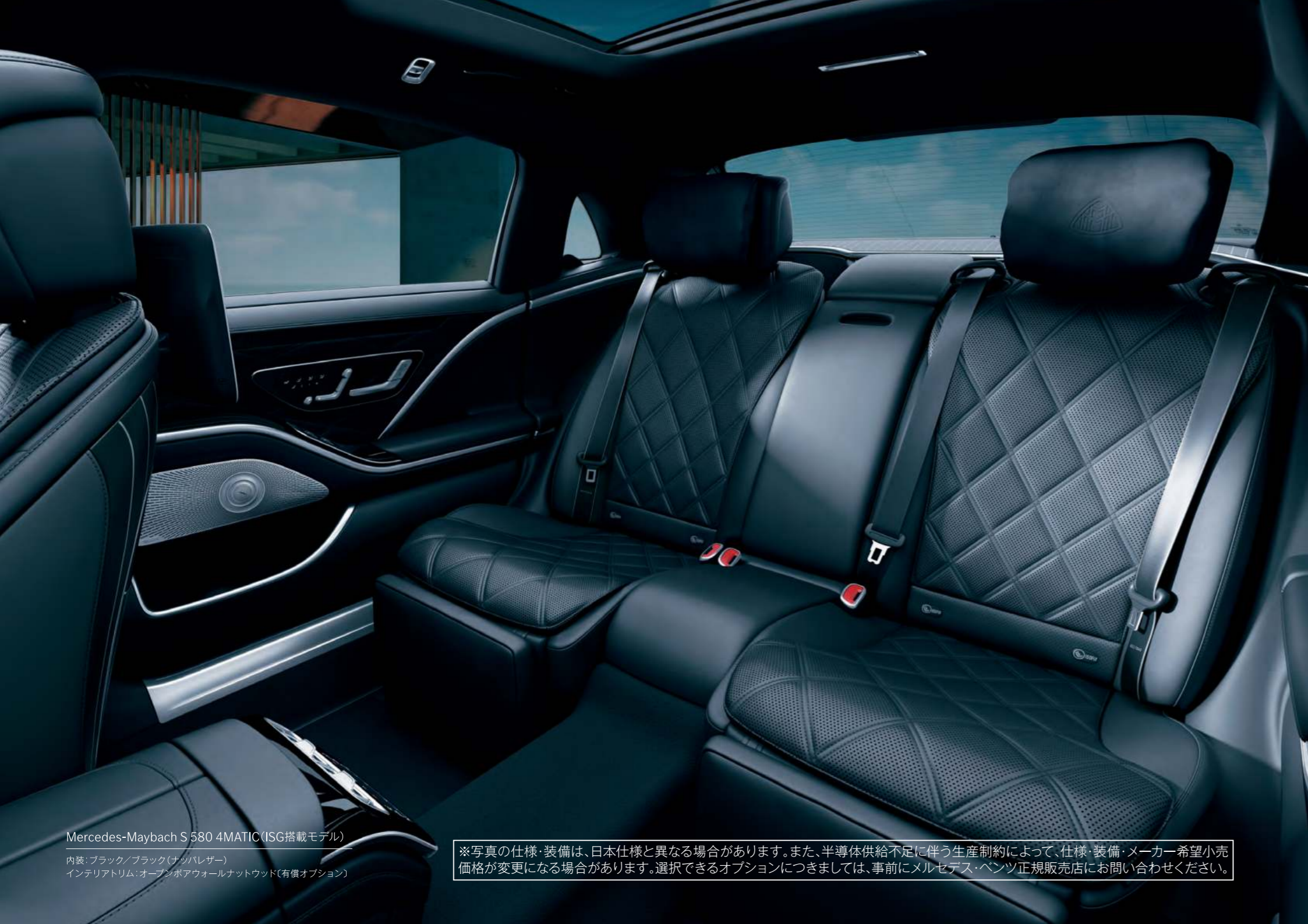
Mercedes-Maybach S 580 4MATIC (ISG搭載モデル)

内装: ブラック/ブラック(ナッパレザー) インテリアトリム: オープンポアウォールナットウッド(有償オプション)