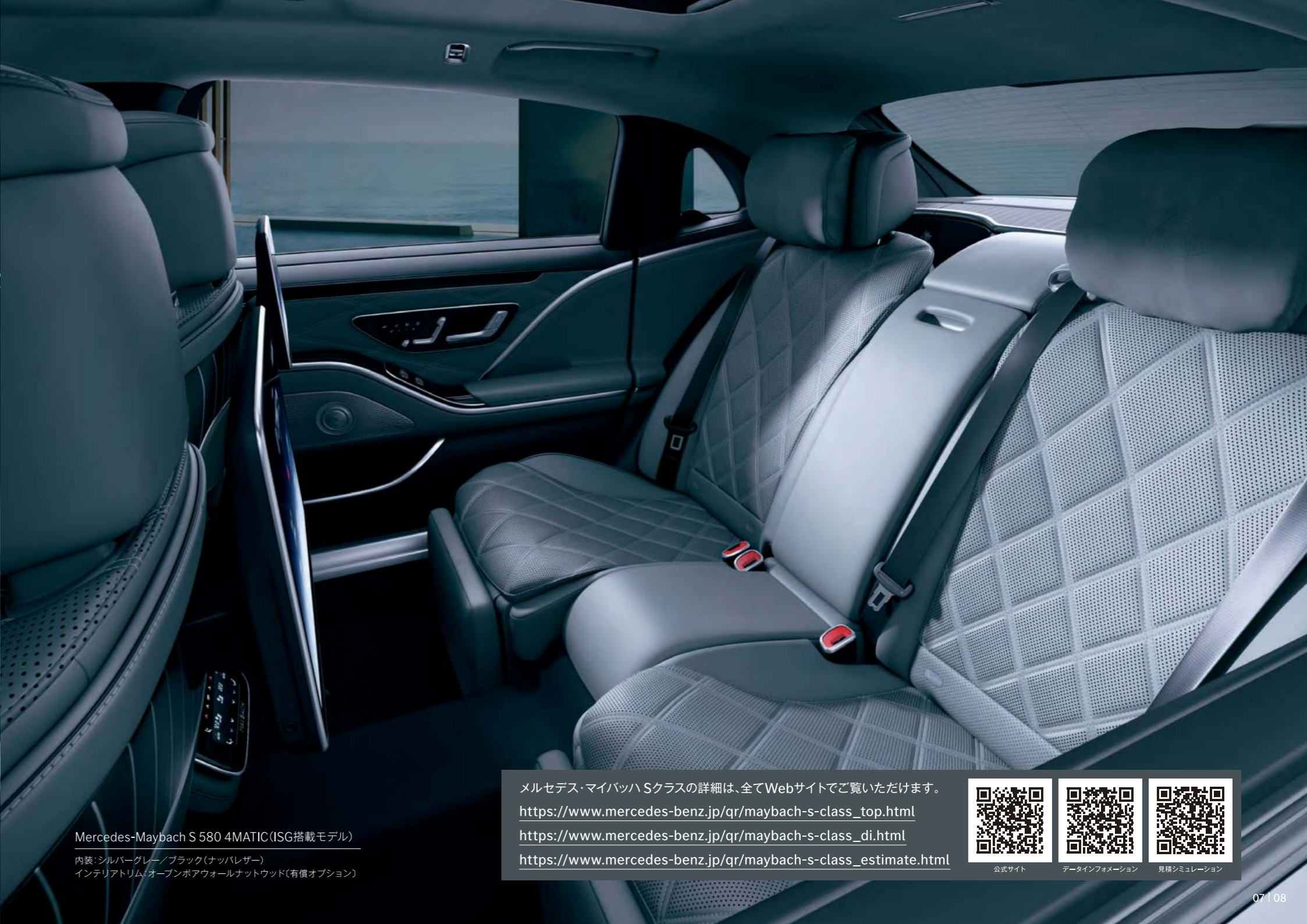
Mercedes-Maybach S 580 4MATIC (ISG搭載モデル)

※写真の仕様・装備は、日本仕様と異なる場合があります。また、半導体供給不足に伴う生産制約によって、仕様・装備・メーカー希望小売価格が変更になる場合があります。選択できるオプションにつきましては、事前にメルセデス・ベンツ正規販売店にお問い合わせください。