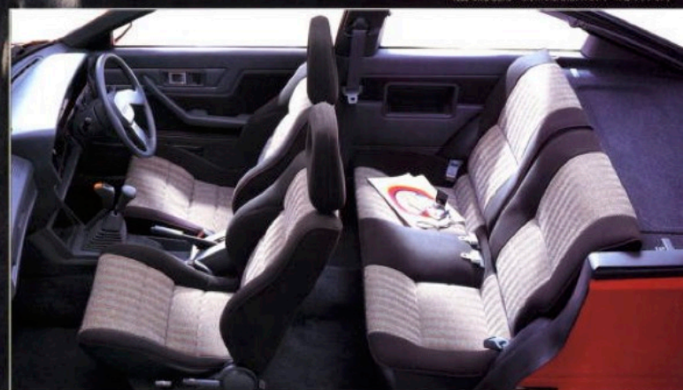
1800 4WD GSRターボ