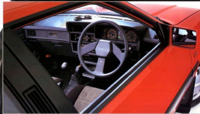
1800 4WD GSRターボ(4WD専用アルミホイールはオプション)

3本スポークステアリングホイール、シーズルーヘッドレスト採用スポーツシート。 6種の充実したメータ類、コックピットに付いた瞬間、ドライバーはコルディアとひとつになれる。