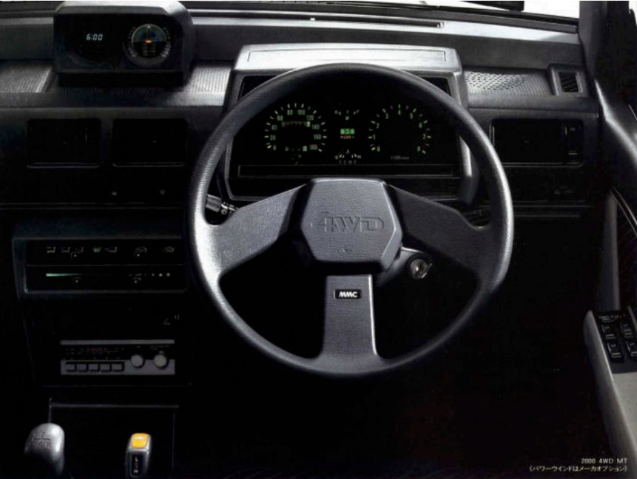
2000 4WD MT (パワーウィンドはメーカーオプション)

デジタル時計付 スーパーシフト、傾斜計、 フルフラットになるシート。 マルチ4WDインテリア。