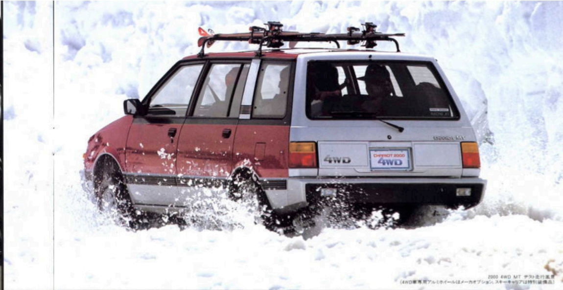
2000 4WD MT 中央走行車 (4WD専用アルミホイールはメーカーオプション、スキーキャリアは特別装備品)

大人7人 (3) がゆったり座れるインテリア。しかもさまざまなパターンを生むマルチシートで、機能的な居住空間を実現。ほかにドアポケット (4) 、リヤサイドボックス (5) など便利な収納スペースも備え、室内のユーティリティを高めています。