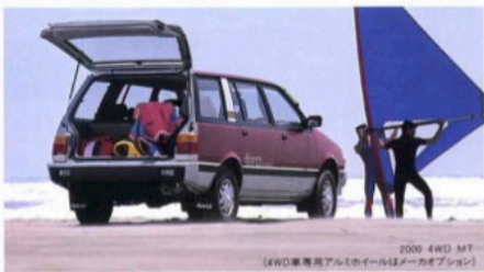
2000 4WD MT (4WD専用アルミホイールはメーカーオプション)

ゆとりある室内高に、ホールド性と座り心地を大切にしたハイポジションのシートを装備。スポーティな3本スポークステアリングホイール (1) は、良好なメータ視認性も確保。そしてメータ内には4WDインジケータを内蔵しています。 (2)