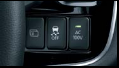
ON / OFF スイッチ

●使用可能日数は当社試算です。●定格消費電力1500W以下でも使用できない機器があります。