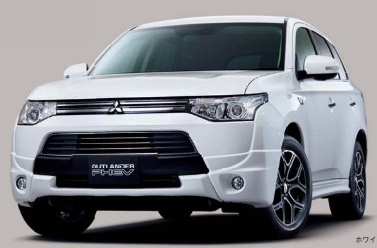
ホワイトパール<SL>※有料色