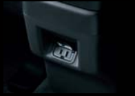
フロアコンソール背面 (2極コンセント)