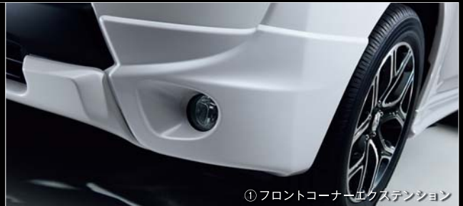
①フロントコーナーエクステンション

消費税抜価格 92,408円： 本体価格 75,248円 + 参考取付工賃 17,160円