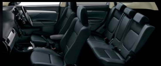
PHOTO ●ベース車：OUTLANDER PHEV SPORTS STYLE EDITION ●装着ディーラーオプション：スタイリングパッケージ ◎掲載写真は、実物とイメージや仕様が異なる場合があります。 ●ボディカラー：ホワイトパール（有料色※） ●画面はハメ込み合成 ●撮影のために点灯 ●シート写真はカットボディによる撮影