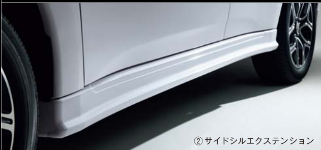
②サイドシルエクステンション