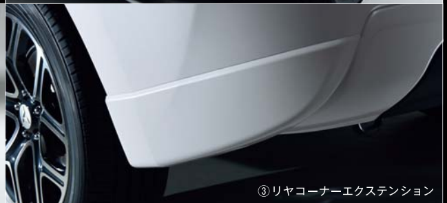
③リヤコーナーエクステンション

スタイリングパッケージをご購入の方は、さらに下記ディーラーオプションを特別価格でご購入いただけます。