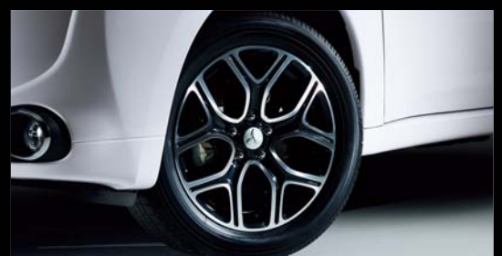
専用18インチラウンドリムタイプアルミホイール(光輝ダークグレー塗装)