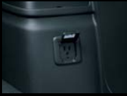
ラゲッジルーム運転席側 (3極コンセント)