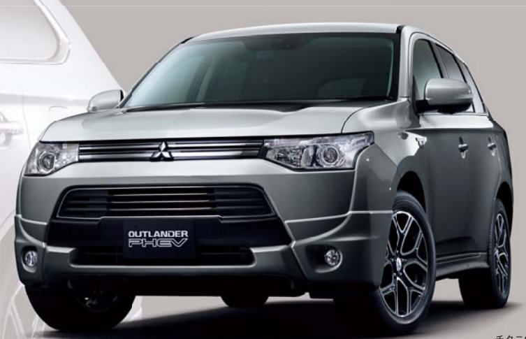
チタニウムグレーメタリック<TR>