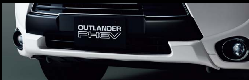
スキッドプレート(カラード、フロント)&専用フロントバンパーセンター(ブラック原着化)