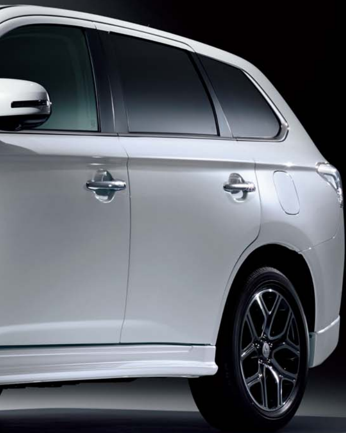
〈スタイリングパッケージ（ディーラーオプション）装着車〉