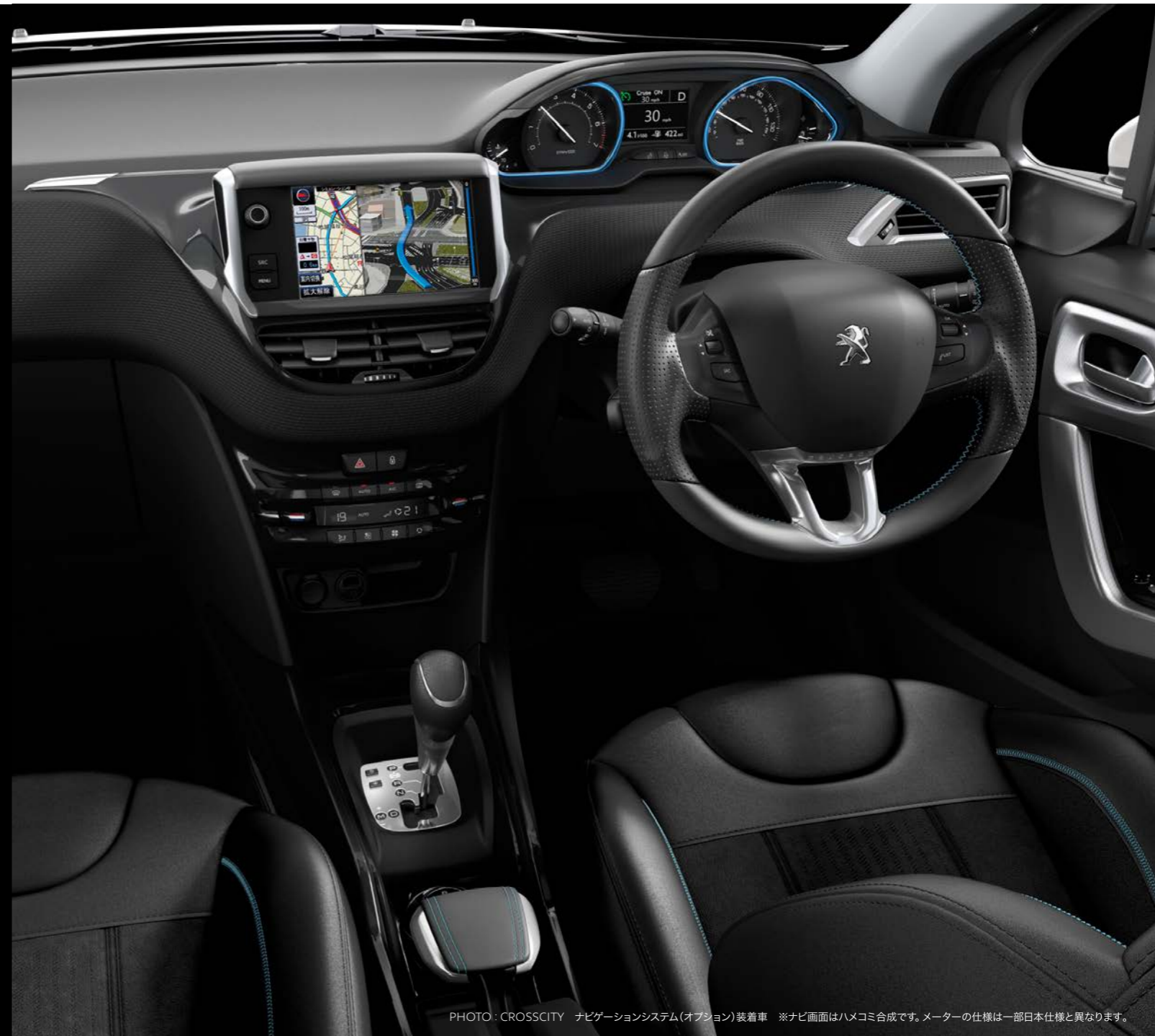
PHOTO: CROSSCITY ナビゲーションシステム(オプション)装着車 ※ナビ画面はハメコミ合成です。メーターの仕様は一部日本仕様と異なります。