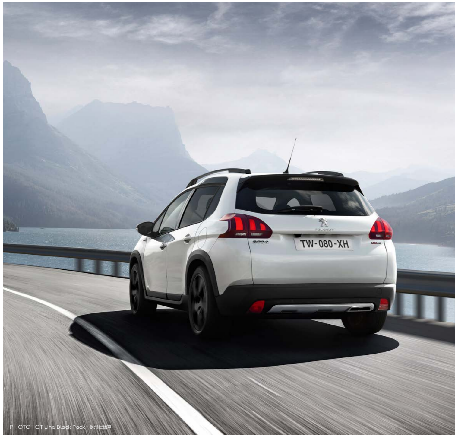
PHOTO : GT Line Black Pack 欧州仕様車