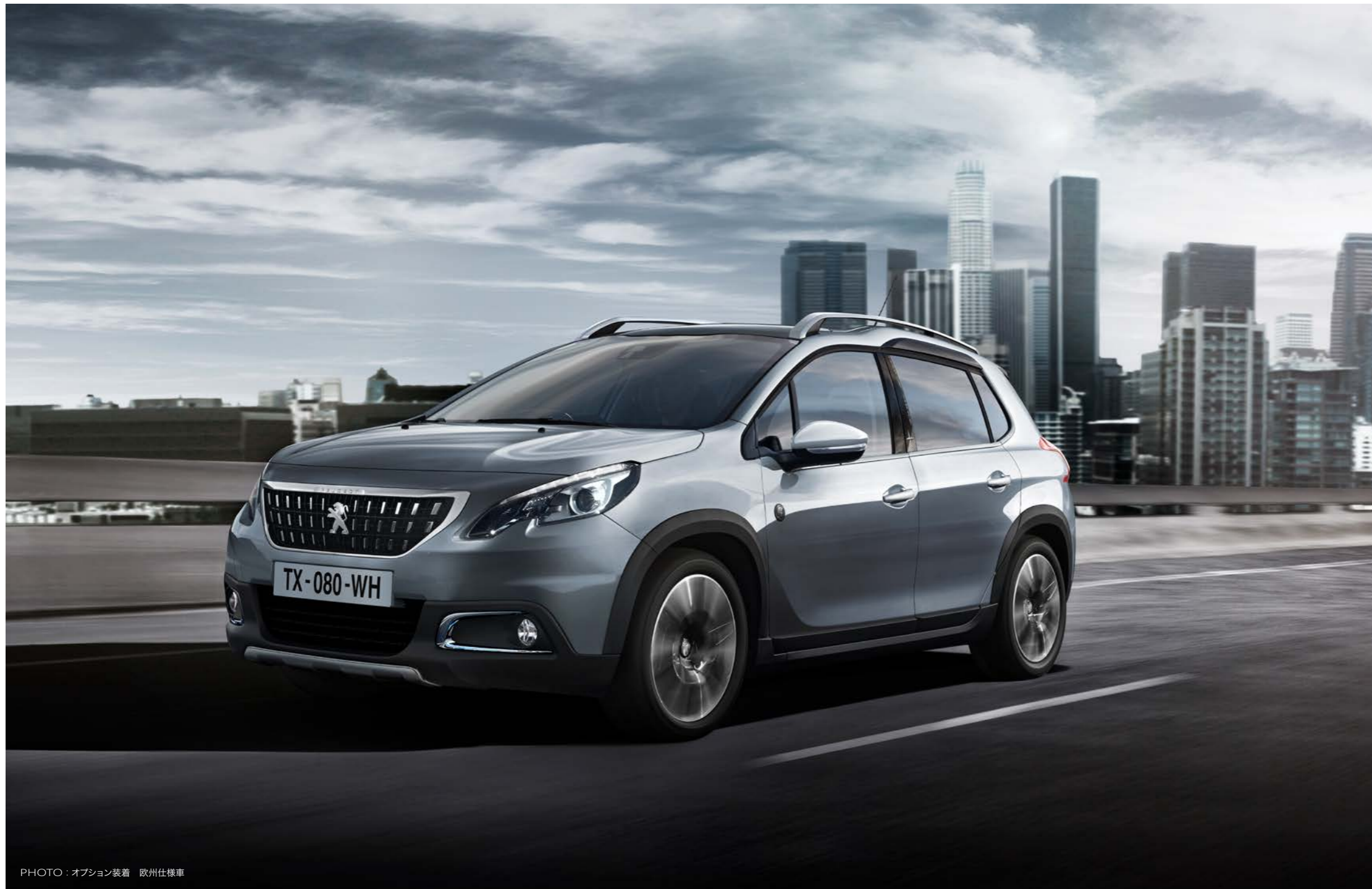
PHOTO : オプション装着 欧州仕様車