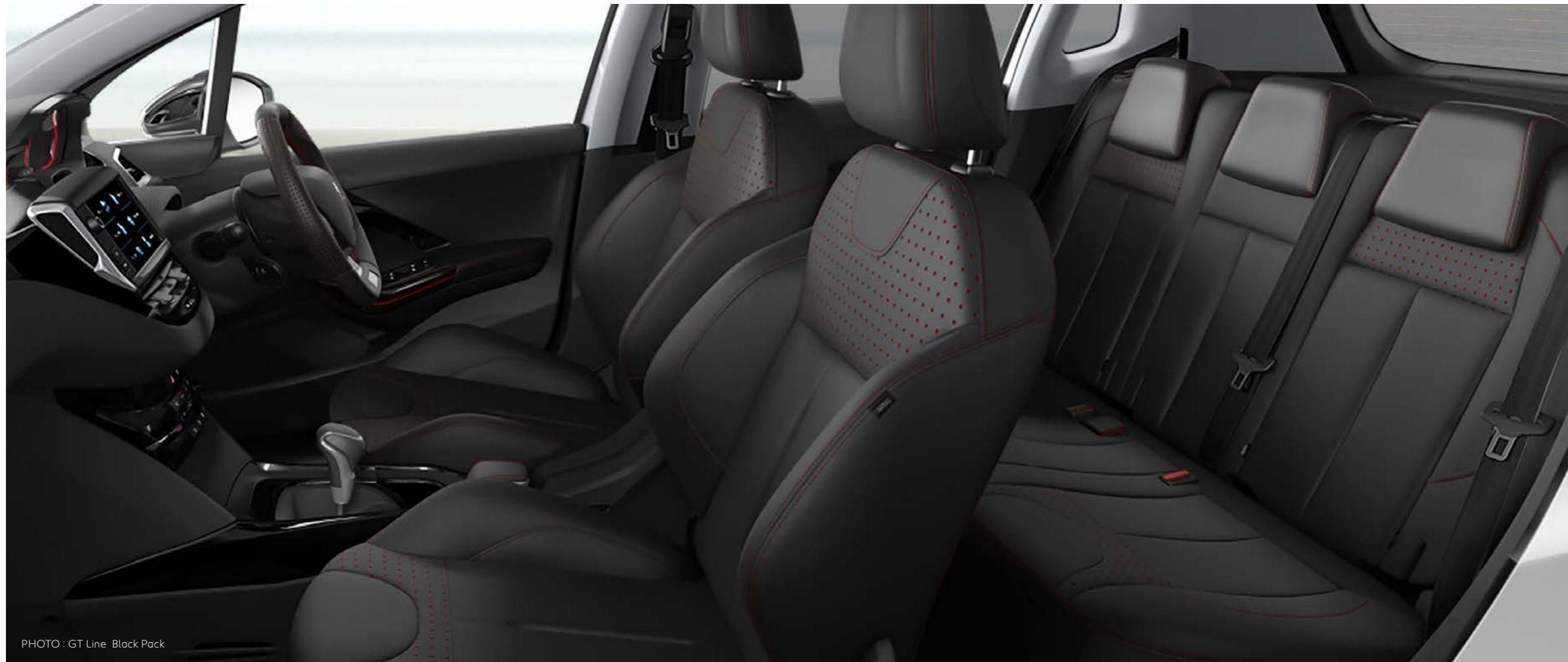
PHOTO : GT Line Black Pack