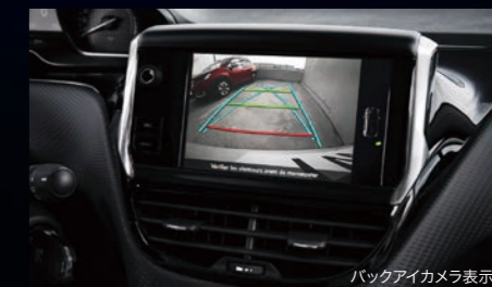
バックアイカメラ表示

※各機能は、ドライバーの運転支援を目的としているため、機能には限界があり、路面や天候などの条件によっては作動しない場合があります。機能を過信せずに常に安全運転をお願いします。詳しくはプジョー正規販売店におたずねください。