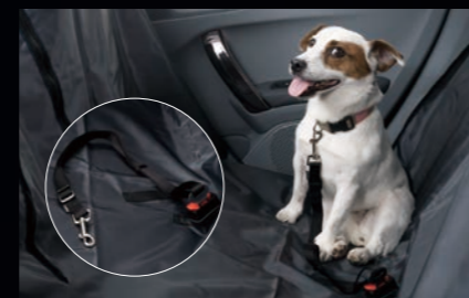
ペット用シートベルト