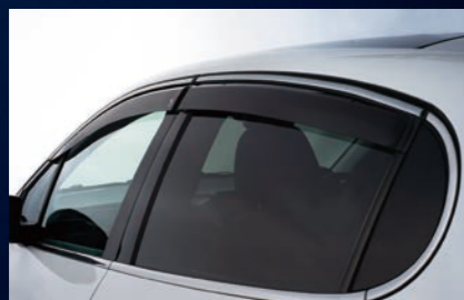
ドアデフレクター