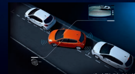
パークアシストイメージ