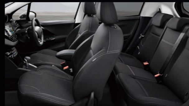
シート地：ファブリック(ハイクオリティ)