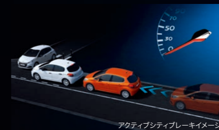
アクティブシティブレーキイメージ