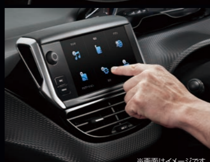
※画面はイメージです。