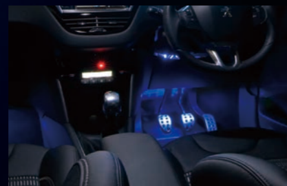
LEDフロントフットランプ左右用(ブルー・ホワイト)