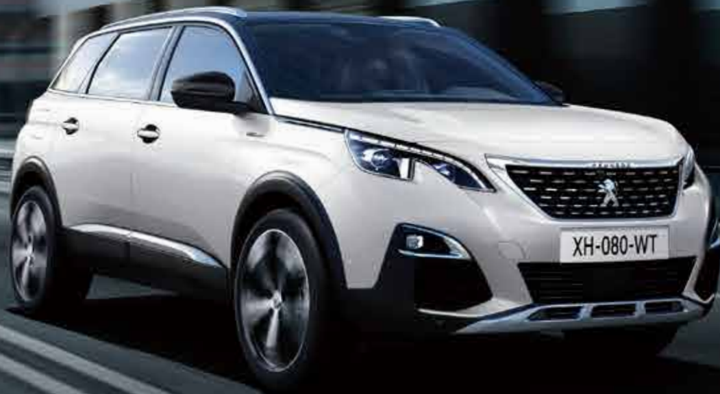
SUV PEUGEOT 5008 GT Line BlueHDi Special Edition