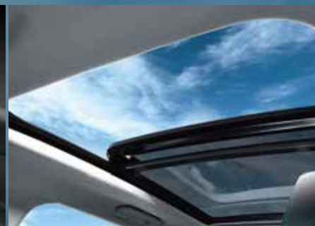
パノラミックサンルーフ (電動メッシュシェード付)