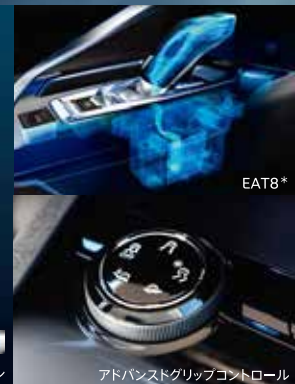
アドバンスドグリップコントロール