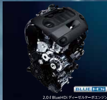
2.0ℓ BlueHDi ディーゼルトターボエンジン