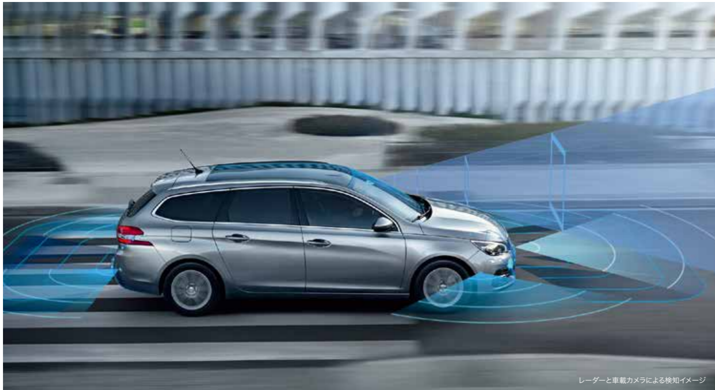
レーダーと車載カメラによる検知イメージ