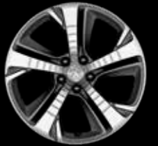
18インチアロイホイール