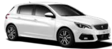
ピアンカ・ホワイト