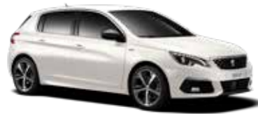
パール・ホワイト