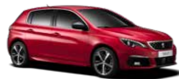
アルティメット・レッド