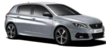
アルタンス・グレー