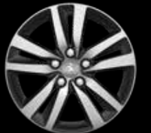
16インチアロイホイール