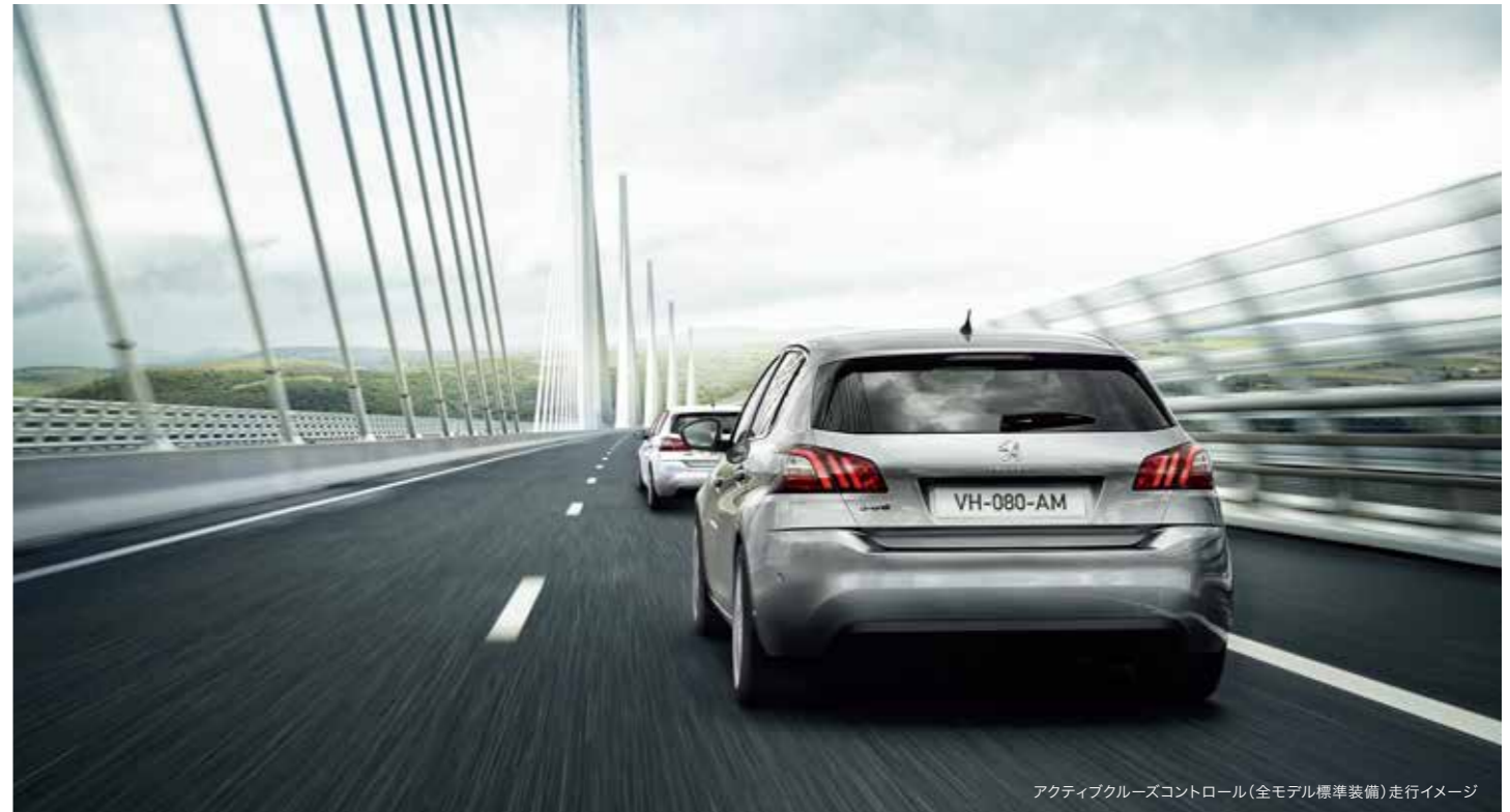
アクティブクルーズコントロール(全モデル標準装備) 走行イメージ