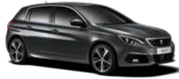
ハリケーン・グレー