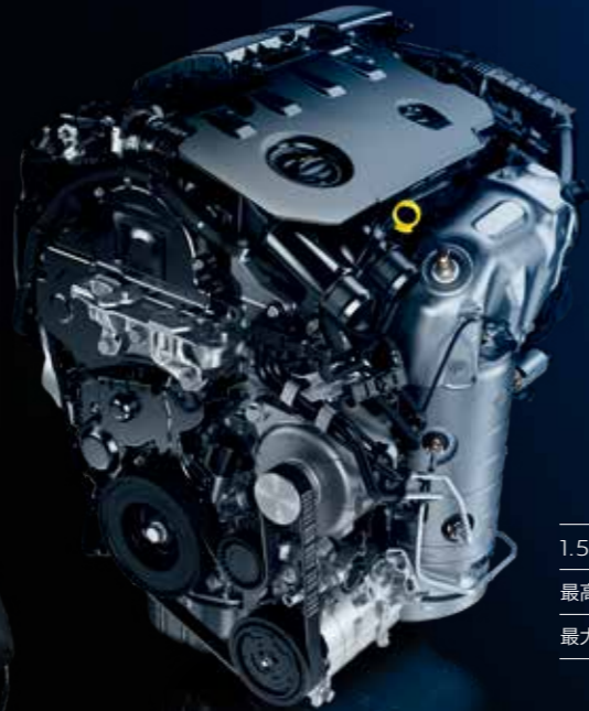
1.5ℓ 直列4気筒 DOHC ターボディーゼル 最高出力:96kW (130ps)/3,750rpm 最大トルク:300Nm/1,750rpm