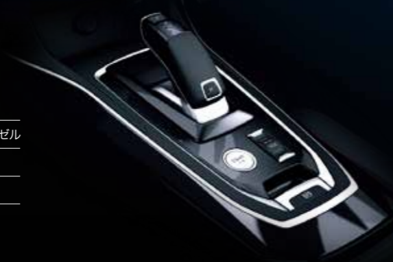
EAT8 8速エフィシエント・オートマチック・トランスミッション