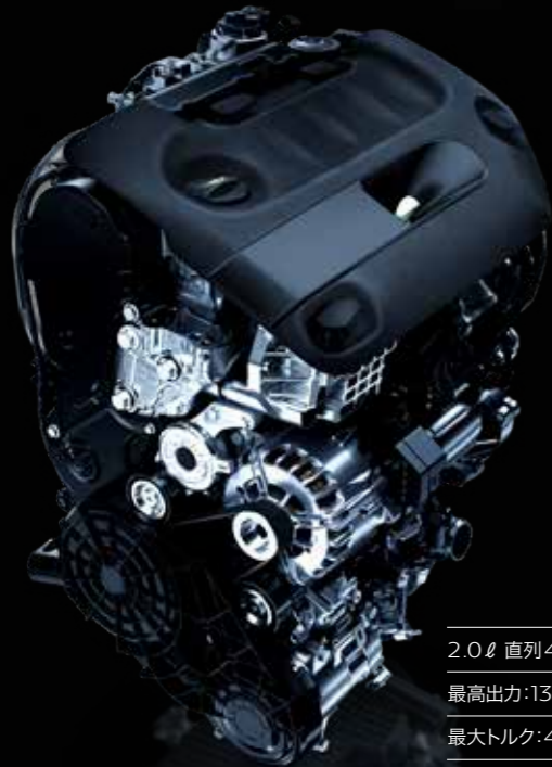
2.0ℓ 直列4気筒 DOHC ターボディーゼル 最高出力:130kW (177ps)/3,750rpm 最大トルク:400Nm /2,000rpm