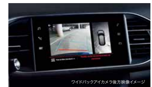
ワイドバックアイカメラ後方映像イメージ

タイヤの回転情報をもとに、いずれかのタイヤ空気圧に大きな変化があった場合、マルチファンクションディスプレイに警告表示します。