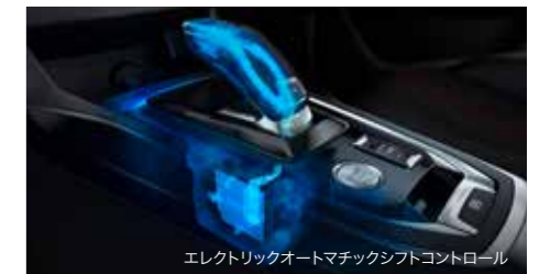
エレクトリックオートマチックシフトコントロール

※燃料消費率は定められた試験条件の値です。お客様の使用環境(気象、渋滞等)や運転方法(急発進、エアコン使用等)に応じて燃料消費率は異なります。