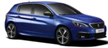
マグネティック・ブルー