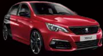
クーブ・フランシュ(アルティメット・レッド/ベルラ・ネラ・ブラック)