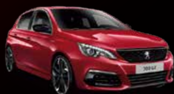
アルティメット・レッド