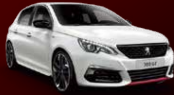
パール・ホワイト