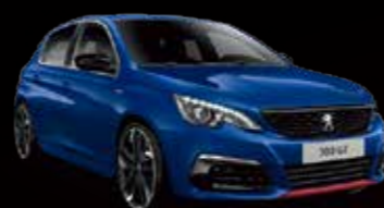
マグネティック・ブルー