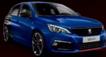
クーブ・フランシュ(マグネティック・ブルー/ベルラ・ネラ・ブラック)