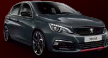
ハリケーン・グレー