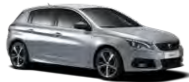
アルタンス・グレー