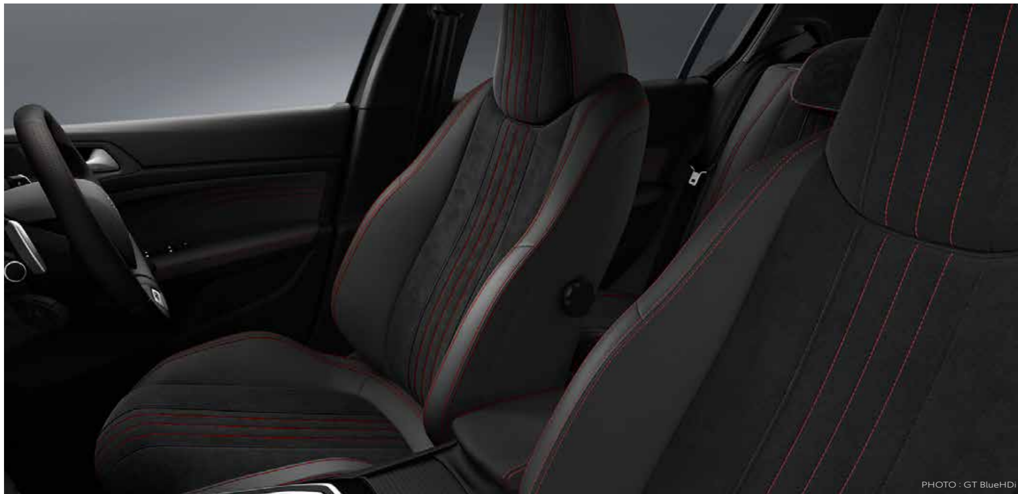
PHOTO : GT BlueHDi