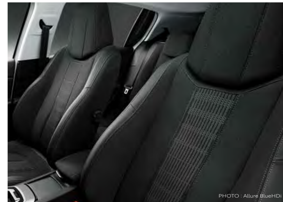
PHOTO : Allure BlueHDi