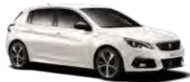
パール・ホワイト