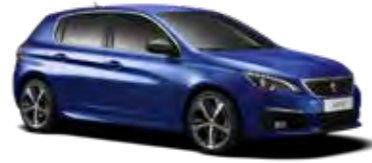
マグネティック・ブルー