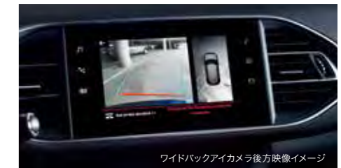
ワイドバックアイカメラ後方映像イメージ

タイヤの回転情報をもとに、いずれかのタイヤ空気圧に大きな変化があった場合、マルチファンクションディスプレイに警告表示します。