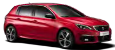
アルティメット・レッド