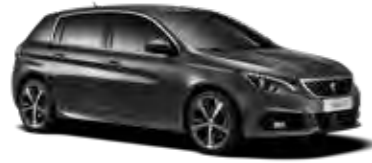
ハリケーン・グレー