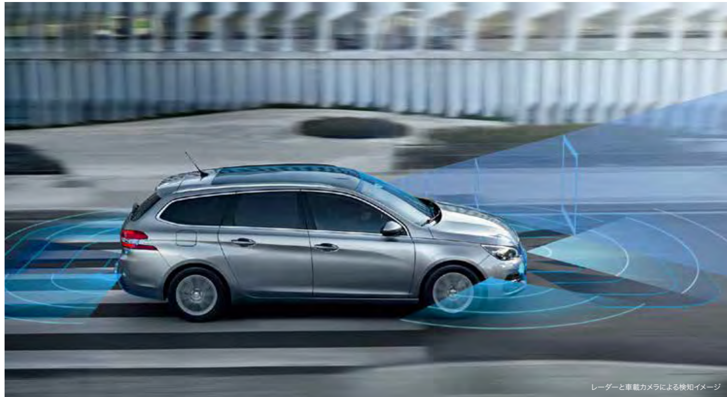
レーダーと車載カメラによる検知イメージ