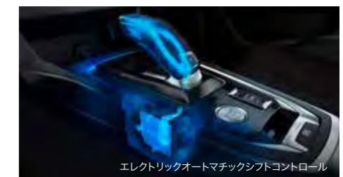
エレクトリックオートマチックシフトコントロール

※燃料消費率は定められた試験条件の値です。お客様の使用環境(気象、渋滞等)や運転方法(急発進、エアコン使用等)に応じて燃料消費率は異なります。