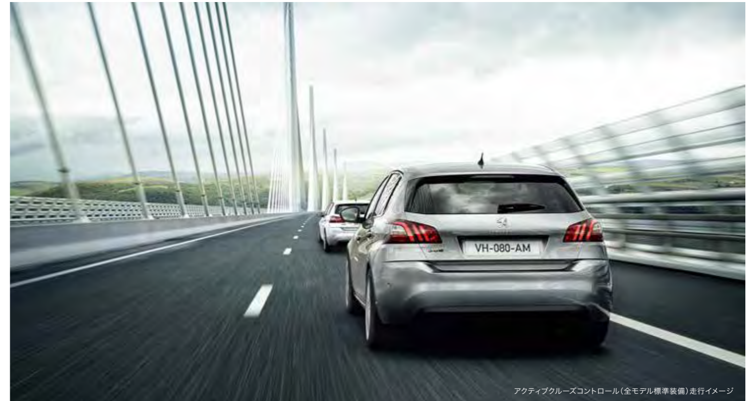
アクティブクルーズコントロール(全モデル標準装備) 走行イメージ