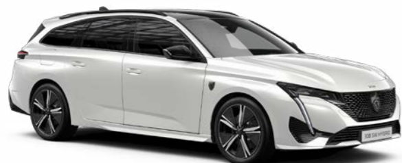
パール・ホワイト