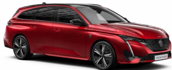
エリクサー・レッド