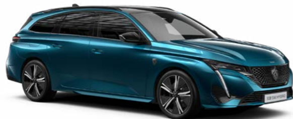
アバター・ブルー