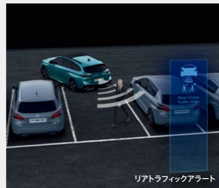
リアトラフィックアラート