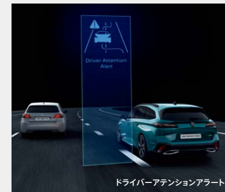
ドライバーアテンションアラート