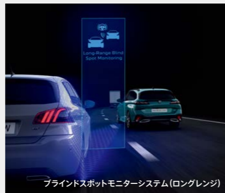
ブラインドスポットモニターシステム(ロングレンジ)