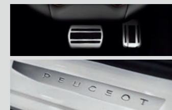
■アルミベダル ■フロントドアステップガード