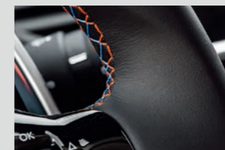
■ブルー&オレンジステッチ・革巻き 小径スポーツステアリングホイール