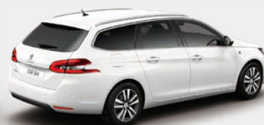
■ 308 TECH PACK EDITION ■ 308 TECH PACK EDITION BlueHDi