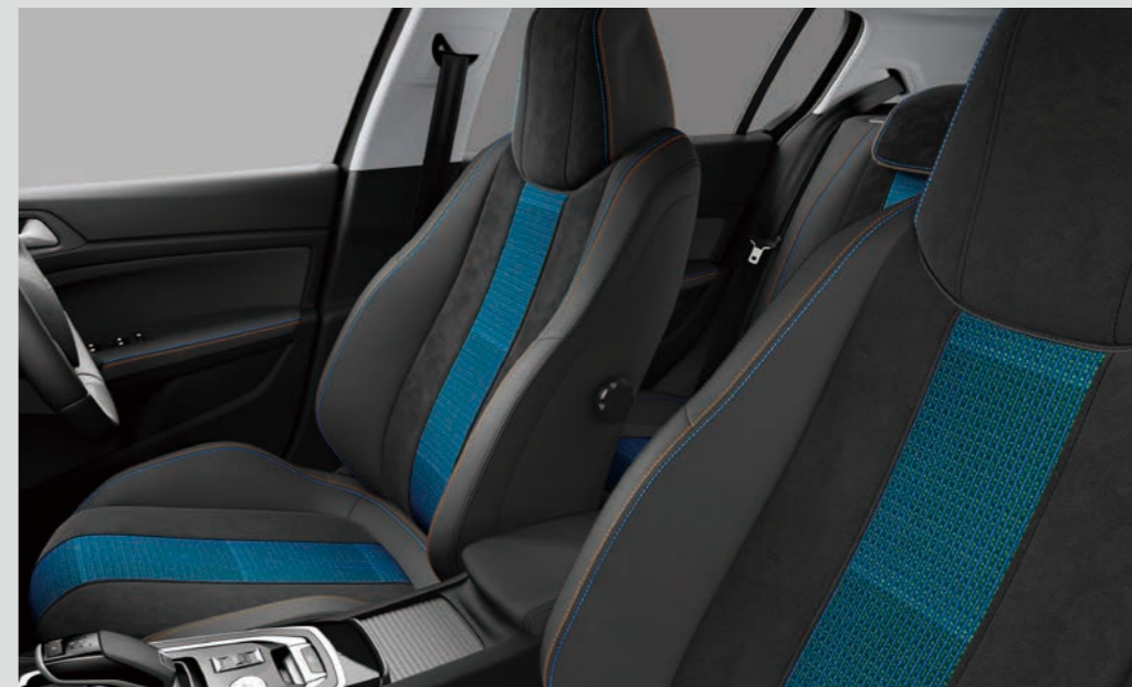
■ブルー&オレンジステッチ・テップレザ/アルカンタラ®スポーツシート