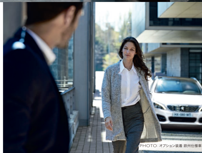
PHOTO: オプション装着 欧州仕様車