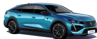
オブセッション・ブルー