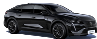
ベルラ・ネラ・ブラック