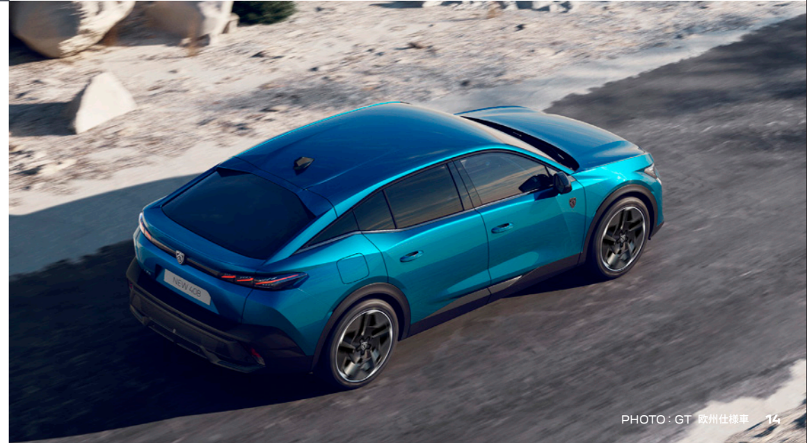
PHOTO: GT 欧州仕様車 14

*1 フランス本社公表値 *2 WLTCモード(国土交通省審査値) EV走行換算距離は定められた試験条件での値です。お客様の使用環境(気象、渋滞等)や運転方法(急発進、エアコン使用等)に応じて走行距離は大きく異なります。