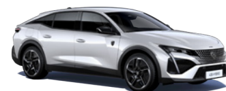
パール・ホワイト