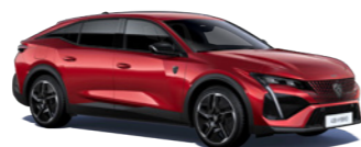
エリクサー・レッド