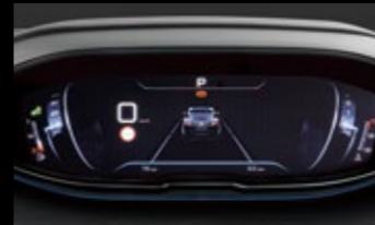
ドライビングモード表示