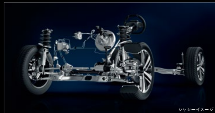
シャシーイメージ

1.6ℓ PureTechツインスクロールターボエンジン*1 軽量コンパクトで、優れた燃費性能を持ちながら、自然吸気2.0ℓクラスのエンジンを凌ぐパワーとトルクを誇るブジョーの中核を成す1.6ℓガソリンターボエンジン。燃料を直接シリンダー内に噴射し燃焼効率を高めるダイレクトインジェクション、すべての回転域で効率の良い過給を行うツインスクロールターボチャージャーなど、数々の先進テクノロジーを搭載。新たに施されたチューニングにより、出力、トルクともにアップし、最高出力133kW(180ps)/