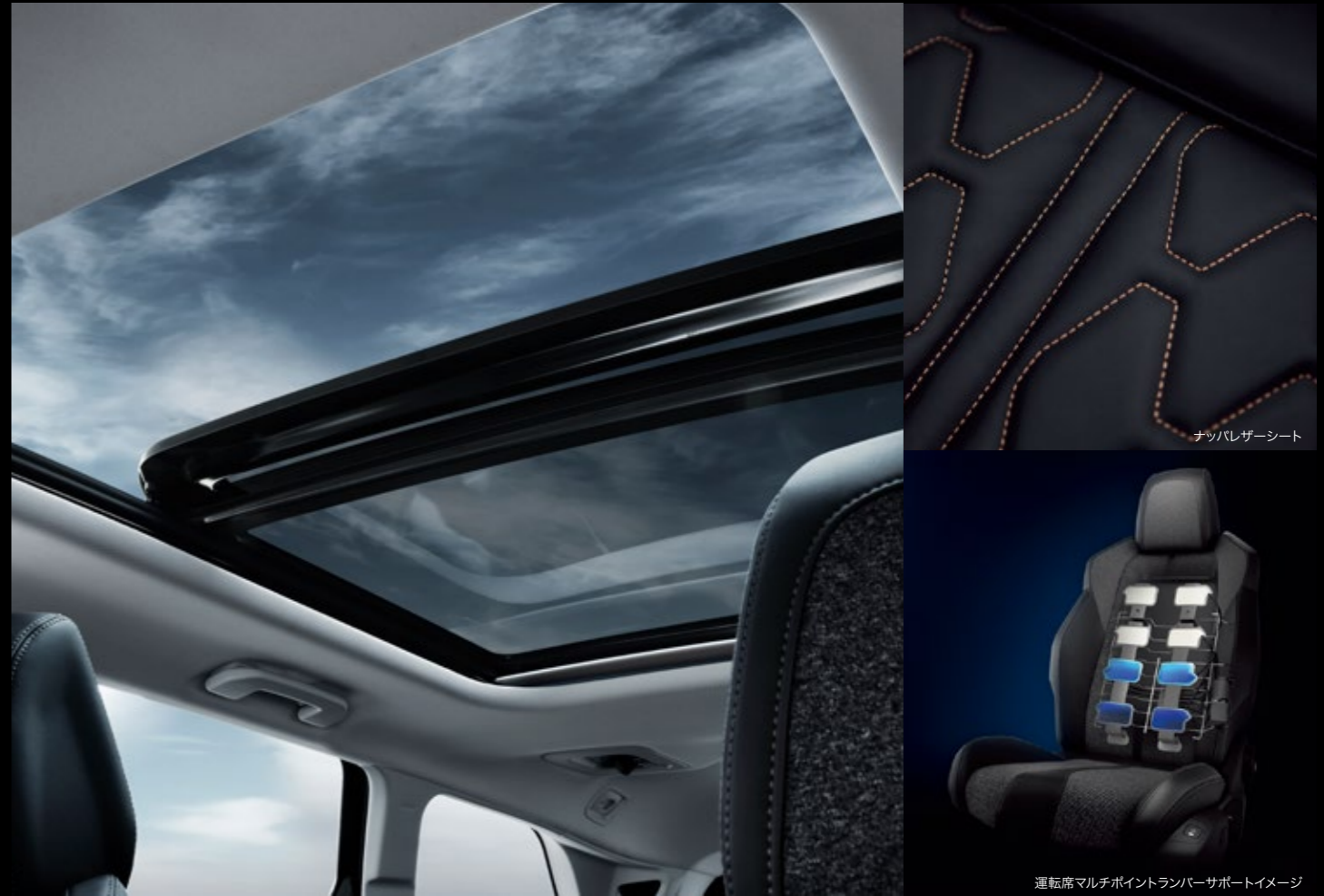
ナッパレザーシート