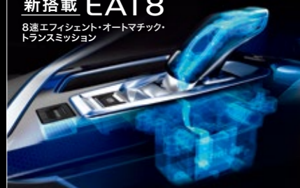
エレクトリックオートマチックシフトコントロール