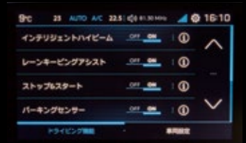
ドライバーアシスタンス設定表示