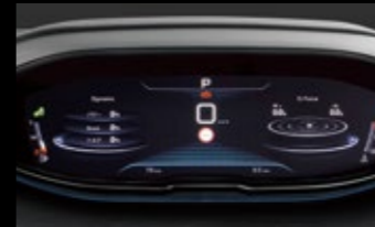
パーソナルモード表示