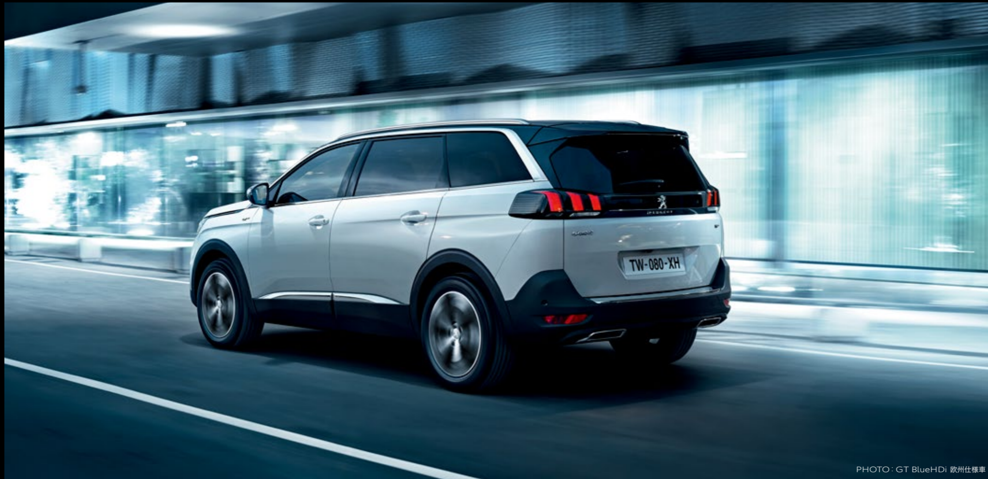
PHOTO : GT BlueHDi 欧州仕様車