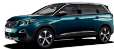
エメラルド・クリスタル