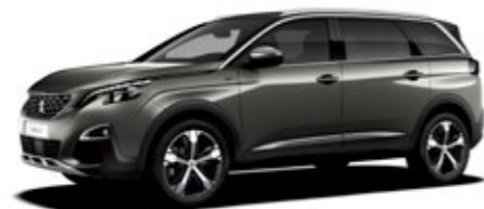
アマゾナイト・グレー