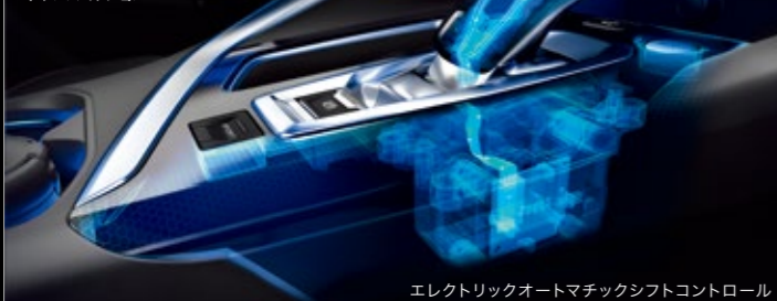
エレクトリックオートマチックシフトコントロール