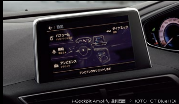
i-Cockpit Amplify 選択画面 PHOTO : GT BlueHDi