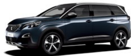
エジプシャン・ブルー