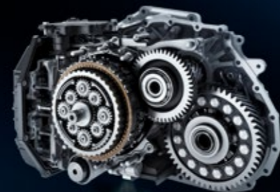
EAT8 メカニズムイメージ