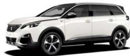
パール・ホワイト