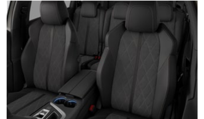
テップレザー / アルカンタラ®シート