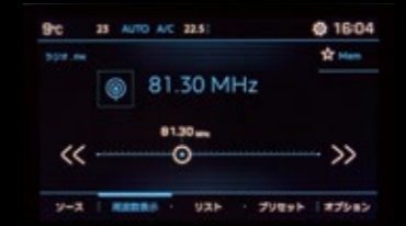
メディア再生表示