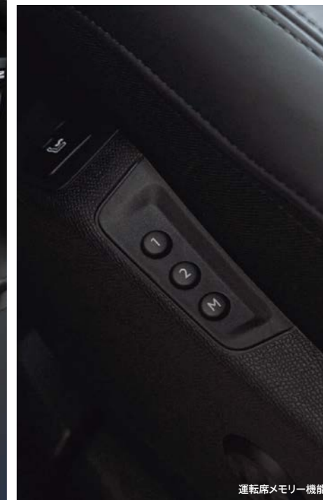
運転席メモリー機能