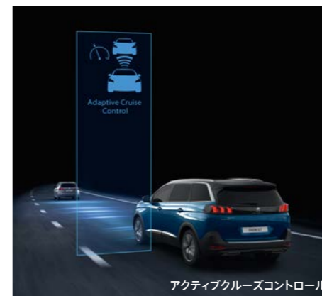
アクティブクルーズコントロール

ブラインドスポットモニターシステム 斜め後方のブラインドスポット(死角)に存在する後続車両