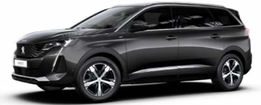
プラチナ・グレー