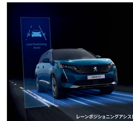
レーンポジショニングアシスト

ワイドバックアイカメラ/サイドカメラ シフトレバーでバックをセレクトすると、車両後方の状況をタッチスクリーンに映し出します。距離や角度が認識できるガイドラインと俯瞰映像により、停車状況が正確に把握できます。またドアミラーに取り付けたカメラによって、