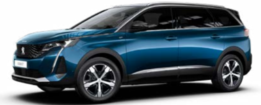
セレベス・ブルー