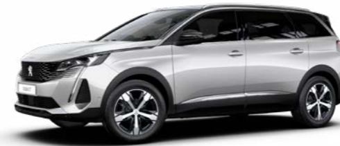
パール・ホワイト