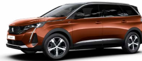
メタリック・コッパー