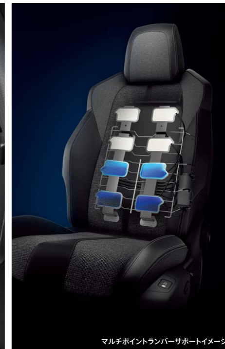
マルチポイントランバーサポートイメージ