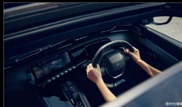
パノラミックサンルーフ