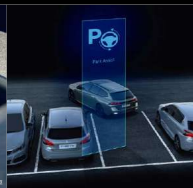
フルパークアシスト