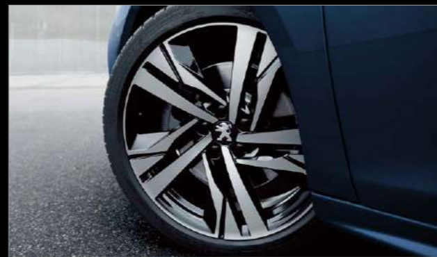
19インチアロイホイール [AUGUSTA]