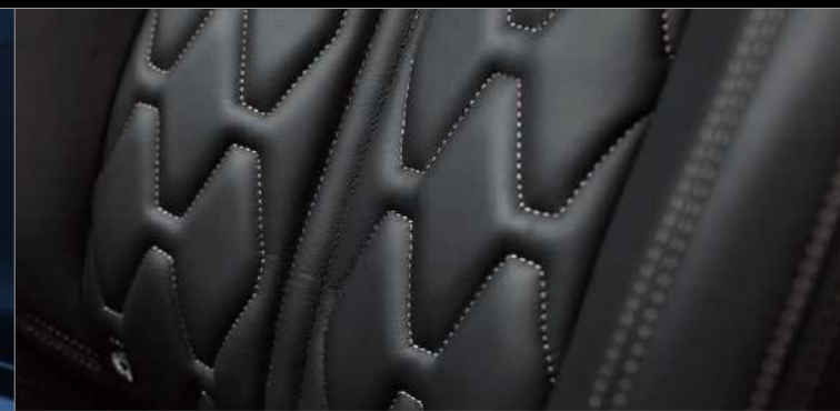
ナッパレザーシート*(ブラック/運転席メモリー付) *一部人工皮革を使用しています。