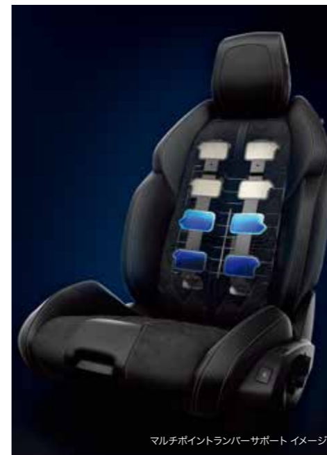
マルチポイントランバーサポート イメージ