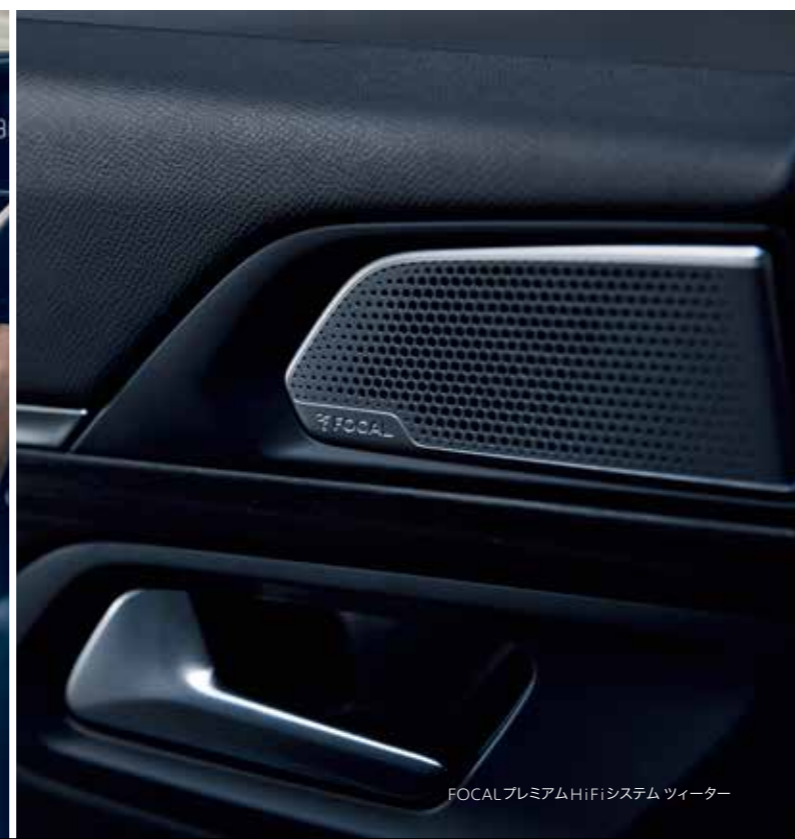
FOCAL プレミアム HiFi システム ツイーター