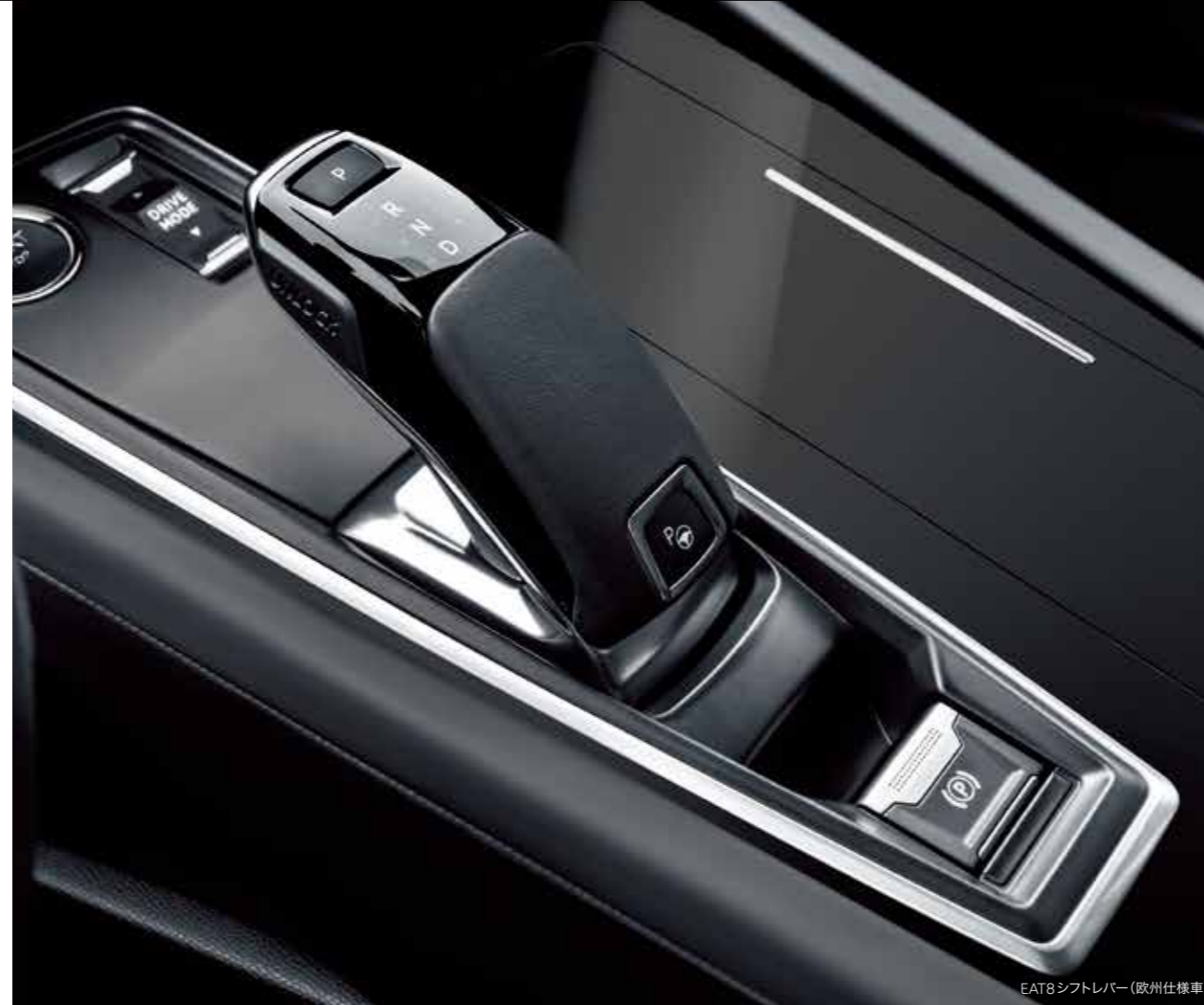
EAT8シフトレバー(欧州仕様車)