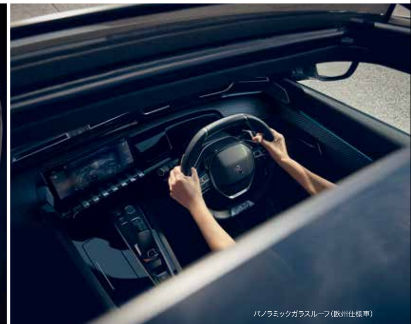
パノラミックガラスルーフ(欧州仕様車)