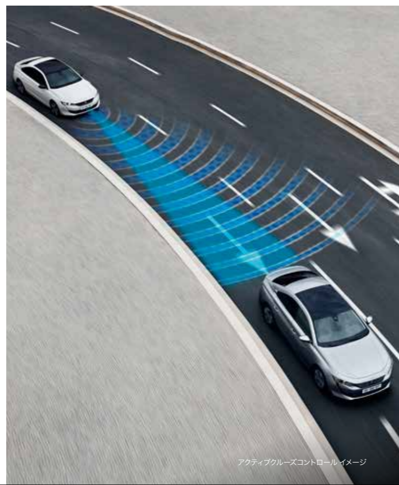
アクティブクルーズコントロール イメージ