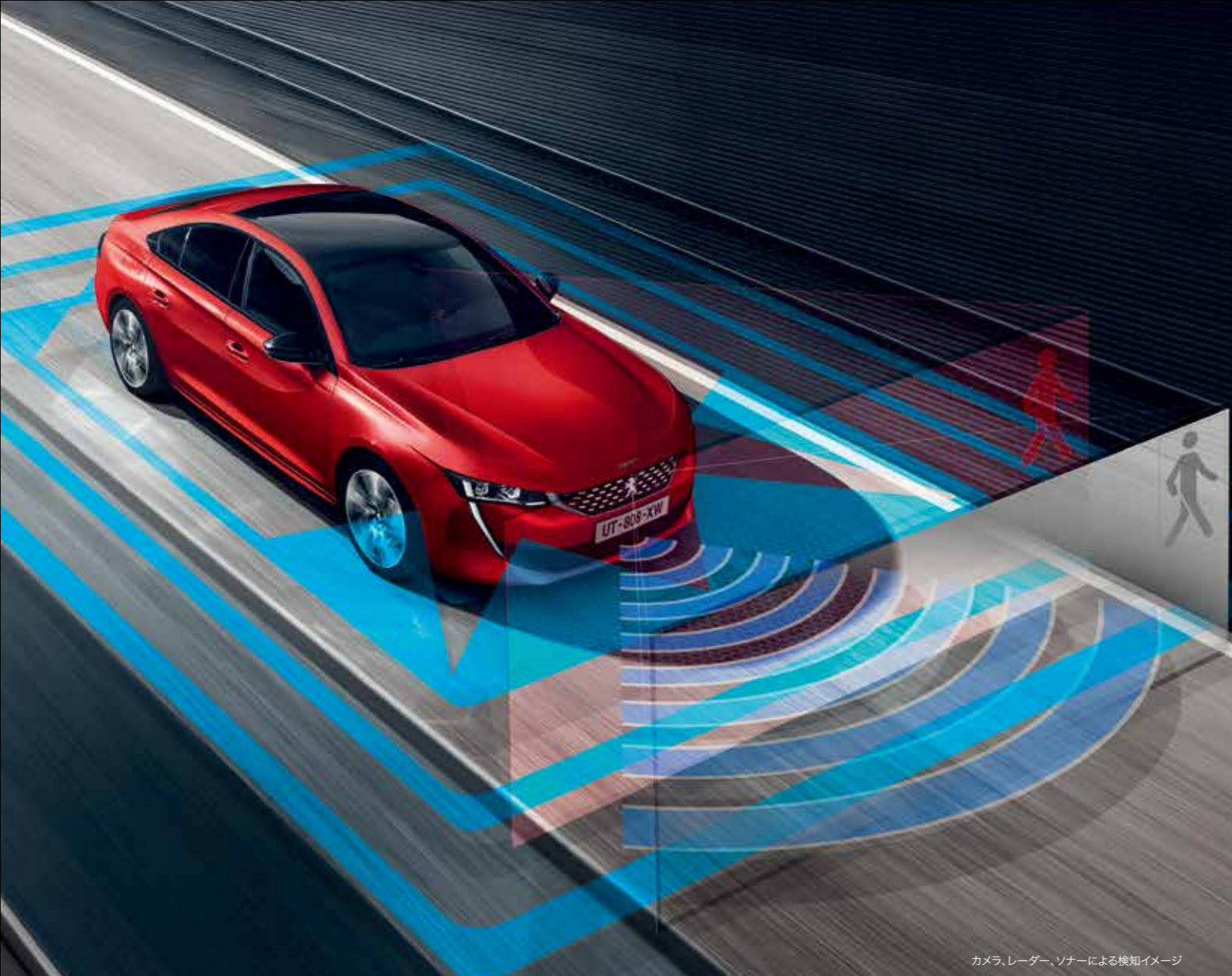
カメラ、レーダー、ソナーによる検知イメージ