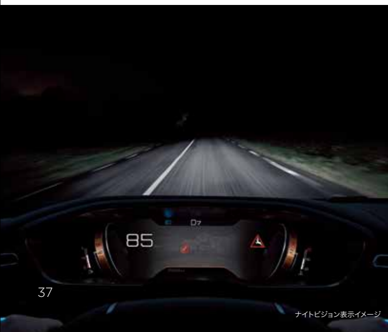
ナイトビジョン表示イメージ

※各機能は、ドライバーの運転支援を目的としているため、機能には限界があり、路面や天候などの条件によっては作動しない場合があります。機能を過信せずに常に安全運転をお願いします。詳しくはプジョー正規販売店におたずねください。