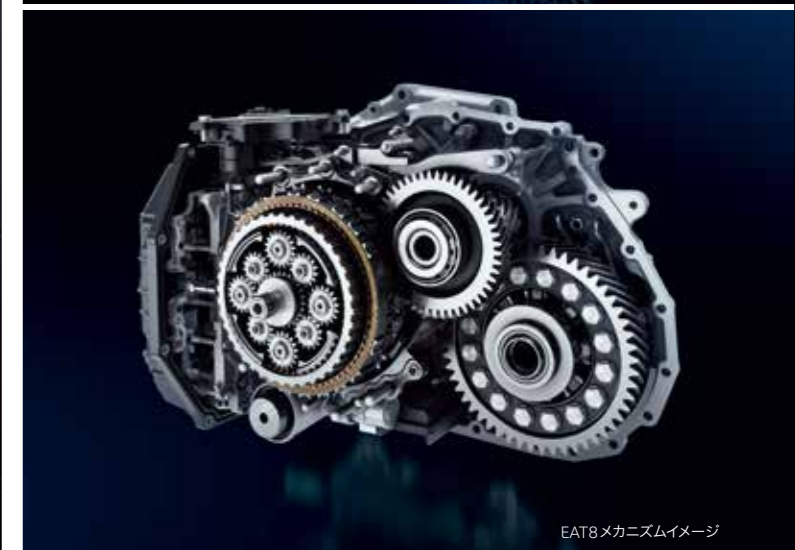
EAT8メカニズムイメージ