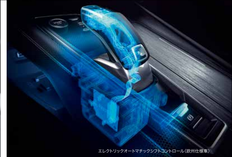
エレクトリックオートマチックシフトコントロール(欧州仕様車)