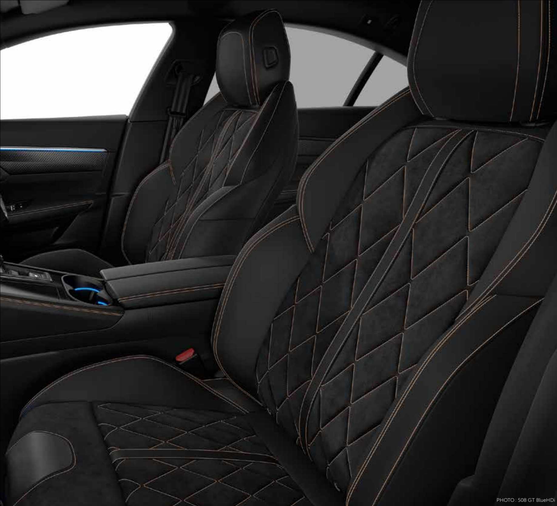
PHOTO: 508 GT BlueHDi