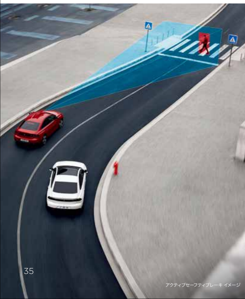
アクティブセーフティブレーキ イメージ

※各機能は、ドライバーの運転支援を目的としているため、機能には限界があり、路面や天候などの条件によっては作動しない場合があります。機能を過信せずに常に安全運転をお願いします。詳しくはプジョー正規販売店におたずねください。