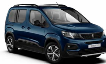
ディーブ・ブルー