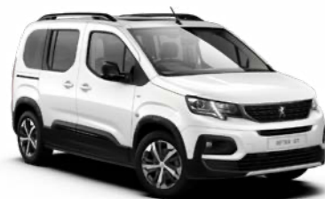
ピアンカ・ホワイト