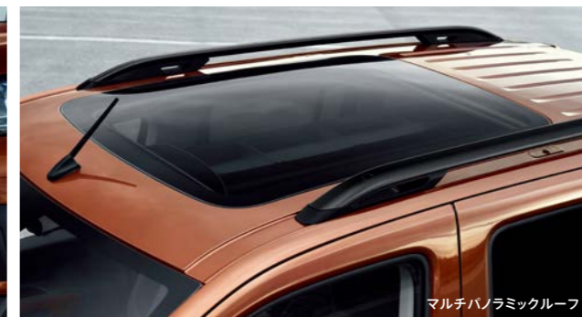
マルチパノラミックルーフ