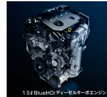
1.5ℓ BlueHDiディーゼルトーボエンジン

エンジンは、最高出力96kW (130ps)/3,750rpmを発揮する高効率クリーンディーゼル1.5ℓ BlueHDiを搭載しました。ディーゼルエンジンならではの豊かなトルクにより、荷物を満載した上り坂でも力強い走りが可能。さらに高回転域でのパワフルさとレスポンスのよさで、ガソリンエンジンに近いフィーリングが楽しめます。また、信号待ちなどでエンジンを自動的に停止、再始動するストップ&スタートシステムを搭載。市街地燃費を大きく向上させています。トランスミッションには、最新世代の8速AT、EAT8*を採用。コンピュータ制御による高精度なギアシフトで、すべての速度域でのエンジンパフォーマンスを引き出すとともに、優れた燃費性能を実現します。*8速エフィシエント・オートマチック・トランスミッション