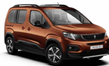
メタリック・コッパー