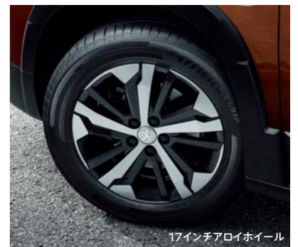
17インチアロイホイール