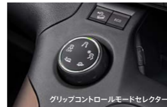
グリップコントロールモードセレクター

より大胆で行動的に楽しむためには、優れた走破性がほしい。 リフターに搭載したアドバンスドグリップコントロールは、雪、砂、ぬかるみといった路面状況に合わせてダイヤルをセットするだけで、トラクションとブレーキを最適に制御するシステム。コストが高く、重さが燃費に影響を及ぼす4WDにすることなく、悪路での走破性を高めます。急な下り坂では、ヒルディセントコントロールが速度を5km/h未満に維持。もっと先へ、奥へと、リフターが行動範囲を広げます。*GTに装備