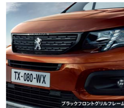
ブラックフロントグリルフレーム