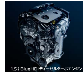
1.5ℓ BlueHDiディーゼルトーボエンジン