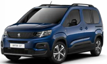
ディーブ・ブルー