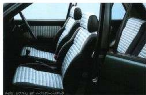
MYME 3ドア 1.6L 1000cc MYME 3ドア 1.6L 1000cc