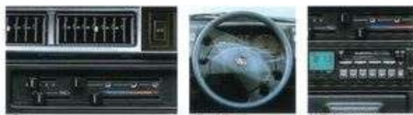
MYME 3ドア 1.6L 1000cc MYME 3ドア 1.6L 1000cc MYME 3ドア 1.6L 1000cc

主要装備 カラードバンパー/カラードサイドプロテクター/フルホイールキャップ/タコメーター/パワーステアリング/時計機能付電子チューニングAM/FMラジオ+カセットステレオ(3ドア車)/エアコン/スポーティシート(3ドア車)/ラゲッジルームランプ(3ドア車)/リヤフォアゲージランプ(3ドア車)/リヤラゲッジランプ