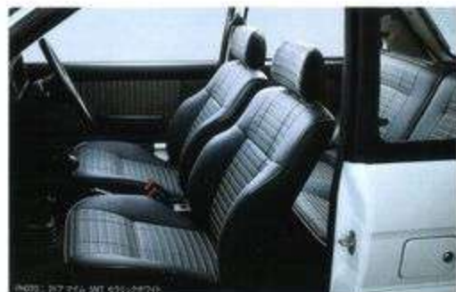
MYME 3ドア 1.6L 1000cc MYME 3ドア 1.6L 1000cc