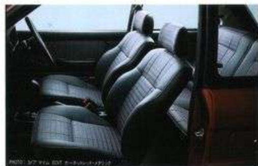
MYME 3ドア 1.6L 1000cc MYME 3ドア 1.6L 1000cc