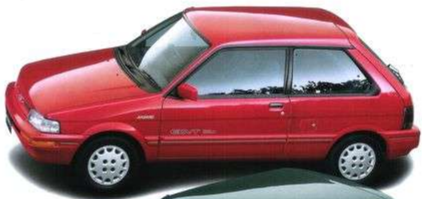
MYME 3ドア 1.6L 1000cc MYME 3ドア 1.6L 1000cc

エアコン、パワーステアリング、カセットステレオ(3ドア車)、カラードバック、スポーティシート(3ドア車)が標準装備。快適さも、走りも、さらに充実。