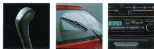
MYME 3ドア 1.6L 1000cc MYME 3ドア 1.6L 1000cc