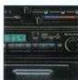
MYME 3ドア 1.6L 1000cc MYME 3ドア 1.6L 1000cc

主要装備 カラードバンパー/カラードサイドプロテクター/フルホイールキャップ/タコメーター/パワーステアリング/時計機能付電子チューニングAM/FMラジオ+カセットステレオ(3ドア車)/エアコン/スポーティシート(3ドア車)/ラゲッジルームランプ(3ドア車)/リヤフォアゲージランプ(3ドア車)/リヤラゲッジランプ