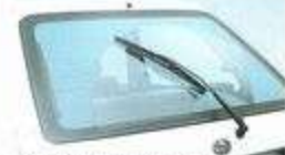
数値プリントリアフォグランプ/ワイパー

カラードアハンドル/カラーサイドプロテクター/フルホイールキャップ/サイドガード/リアワイパーウォッシャー/可開式カラードリアミラー(鏡域式リモコン)/タコメーター/パワーステアリング/時計機能付電子チューニングAMラジオ/スポーティシート(3ドア車)/ラゲッジスラムランプ(S/A車)/フロントドアポケット/リアクォーターポケット(S/A車)/リヤラッシュガード