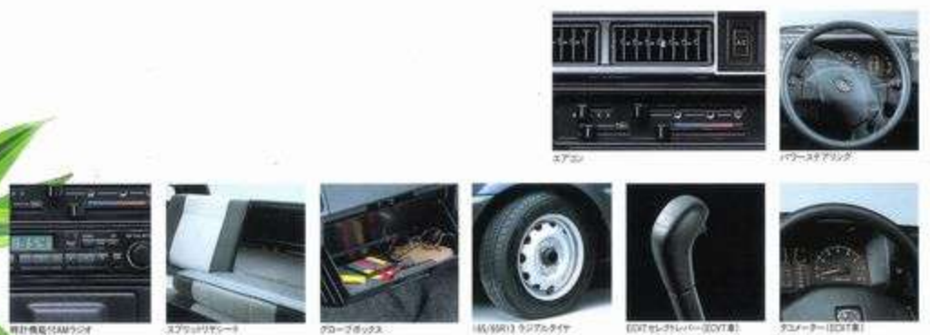
時計機能付AMラジオ