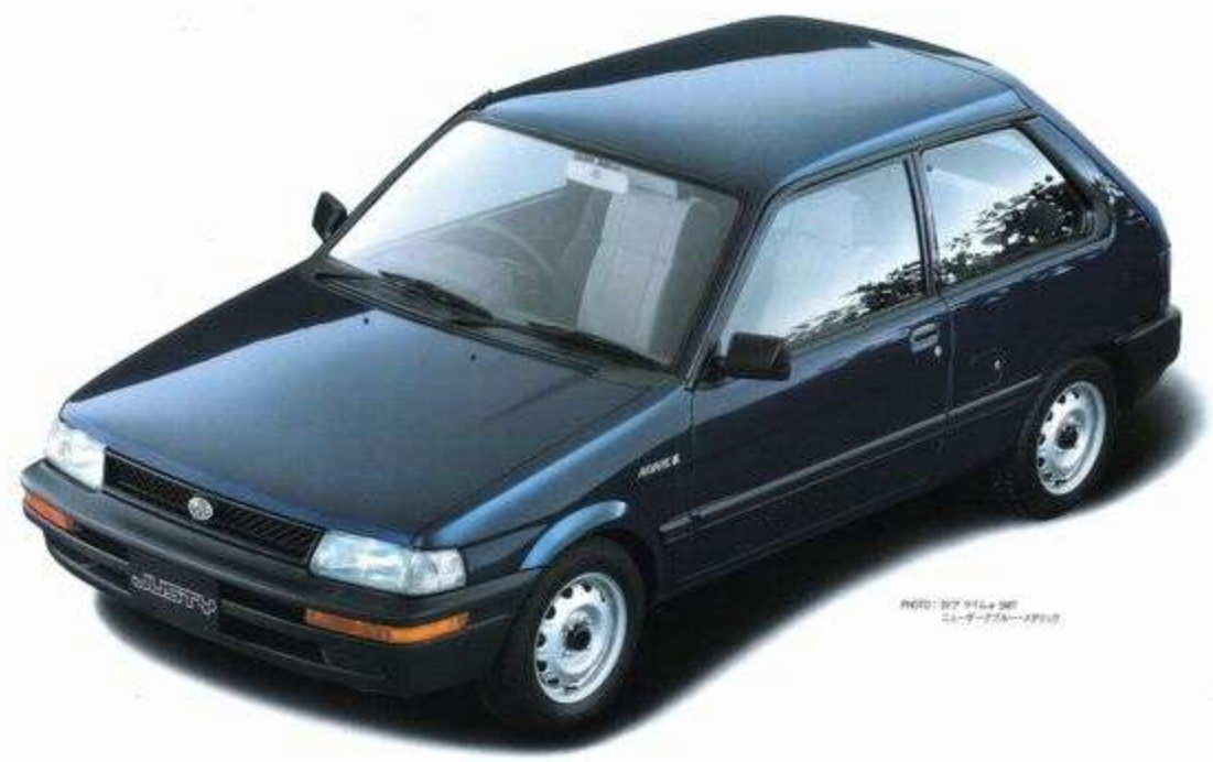
FF MYME \alpha 3door ニューオーブリーメック