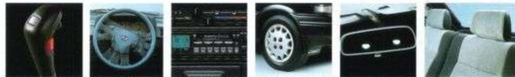
5CVT 517 7443 3DT 230 97 700 パワーステアリング AM/FMラジオ+カセットステレオ 230cc 4気筒 16Vエンジン 15インチホイール 15インチホイール 15インチホイール