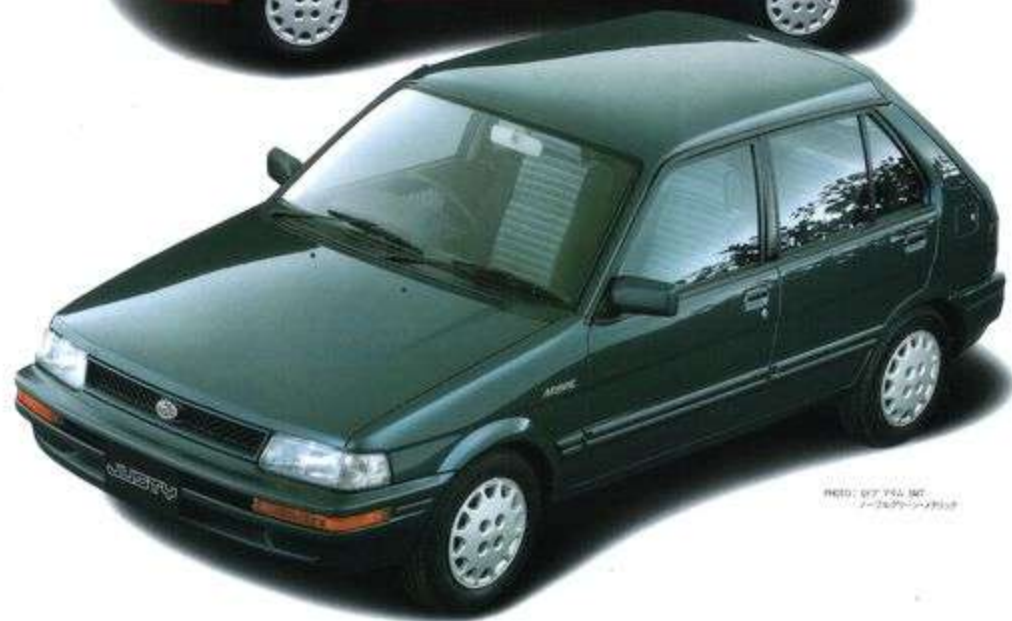
MYME 5ドア 1.6L 1000cc MYME 5ドア 1.6L 1000cc