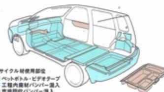
リサイクル材使用部位 ● ペットボトル・ビデオテープ ■ 工用内装材(バンパー・ドア) ■ 樹脂製バンパー・ドア ■ 樹脂