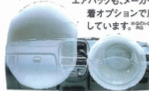
SRSエアバッグ作動イメージ SRS=Supplemental Restraint System [補助拘束装置]

レガシィでつちかっ「新環状力骨構造」。ネスタは、このボディ構造により、軽規格を大きく上回る全方位55km/hの高度な衝突安全を実現しました。また、万が一にそなえ運転席SRSエアバッグ ※ を標準装備。デュアルSRSエアバッグも、メーカー装着オプションで用意しています。 ※ 90i-CVT車。