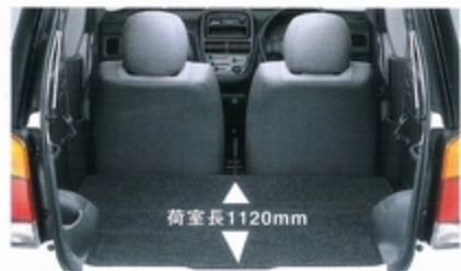
2人乗車時なら大きな荷物もなんなく収納