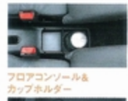
フロアコンソールと カップホルダー