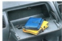
インパネマルチボックス 助手席側のインパネには、テーブル代わりに使えるトレイ付の収納スペースを用意しました。