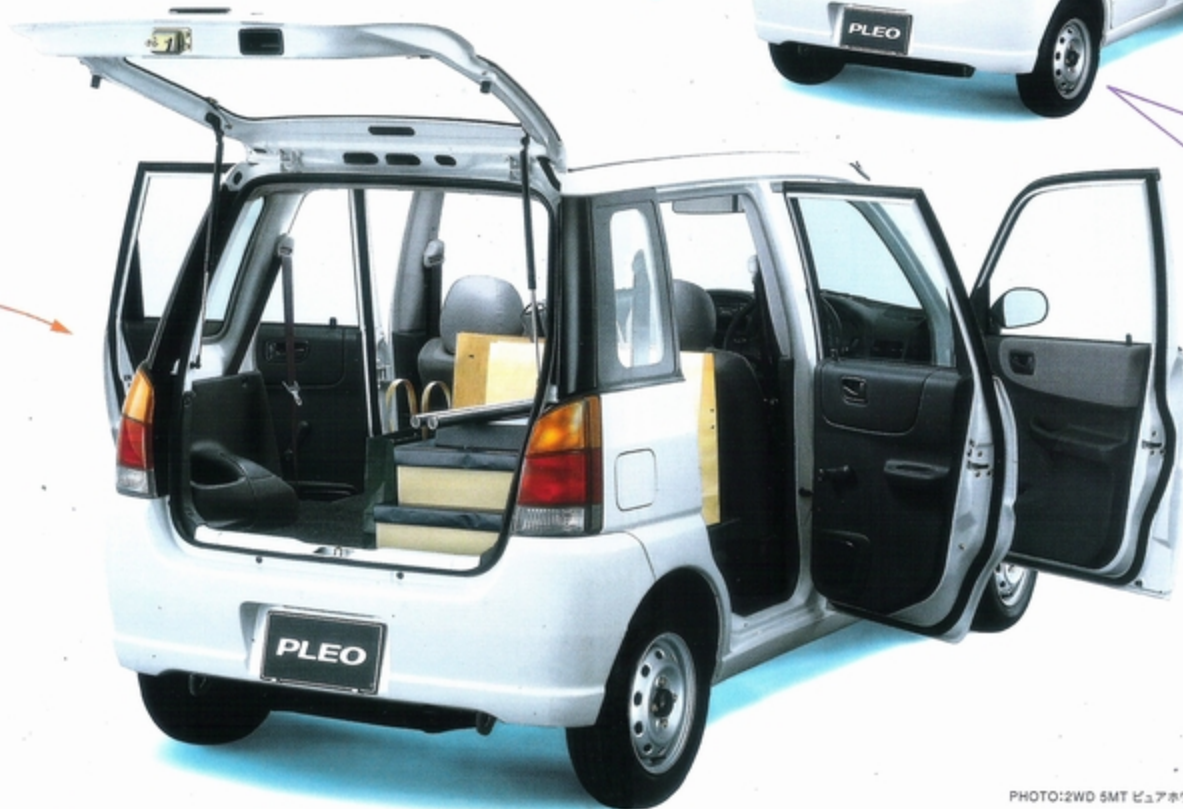
PHOTO:2WD 5MT ビュアホワイト

背が高いから使いやすい。 しかも走りもいい。 毎日乗るなら プレオ5ドアバンです。