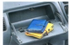
インパネマルチボックス 助手席側のインパネには、テーブル代わりに使えるトレイ付の収納スペースを用意しました。