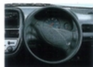
パワーステアリング 軽やかに安定した操作感覚です。