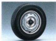
155/70R12ラジアルタイヤ 走行性・耐久性に優れています。