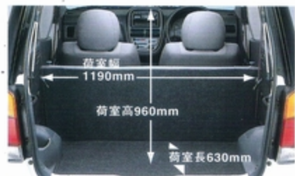
4人乗車時でもたっぷり収納