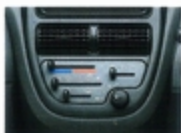
エアコン(エコノモード付) オールシーズン室内を快適に保ちます。