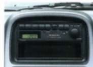
時計機能付電子チューナー AMラジオ ワンタッチ選局のAMラジオです。