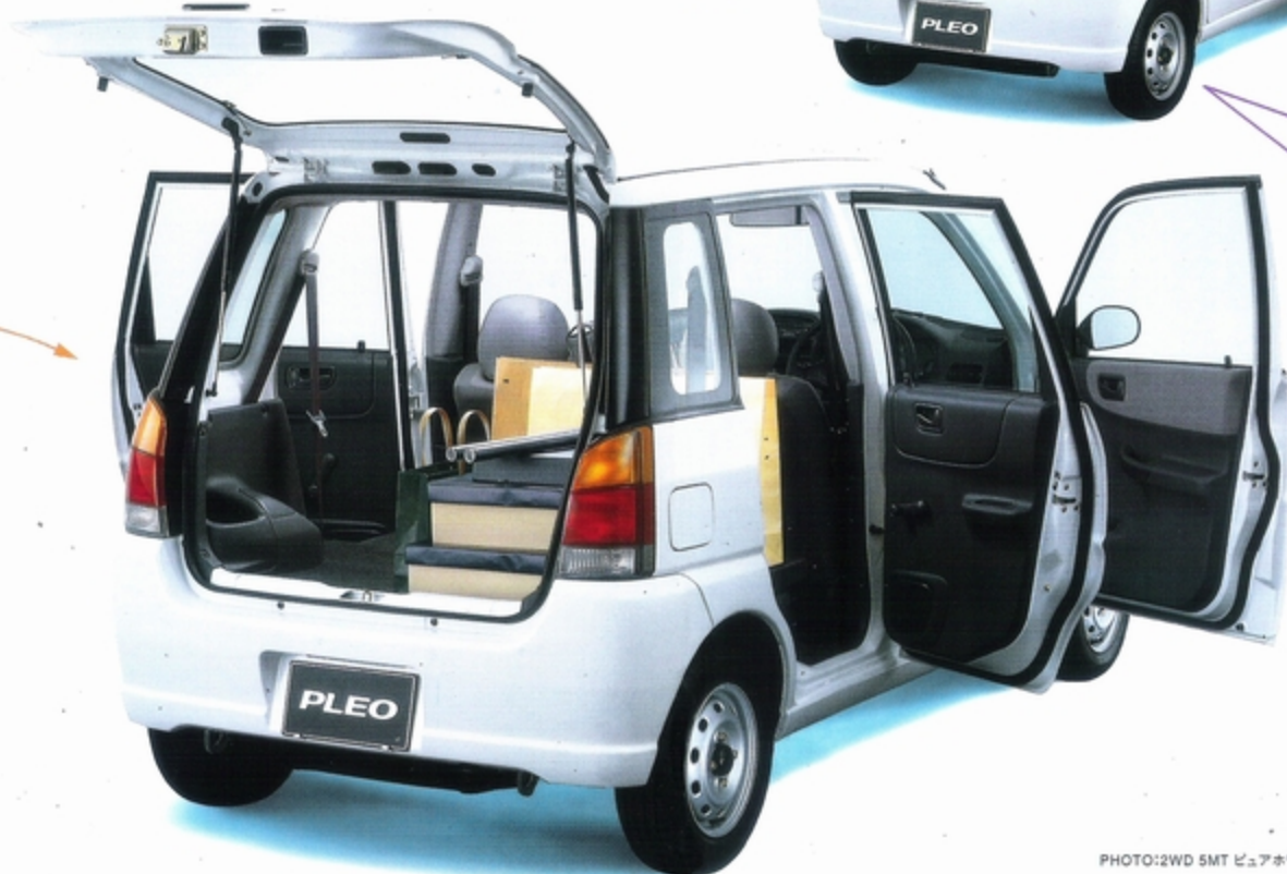
PHOTO:2WD SMT ビュアホワイト

背が高いから使いやすい。 しかも走りがいい。 毎日乗るなら プレオ5ドアバンです。