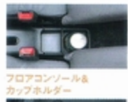
フロアコンソール& カップホルダー