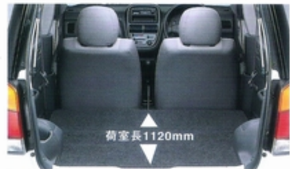
2人乗車時なら大きな荷物もなんなく収納