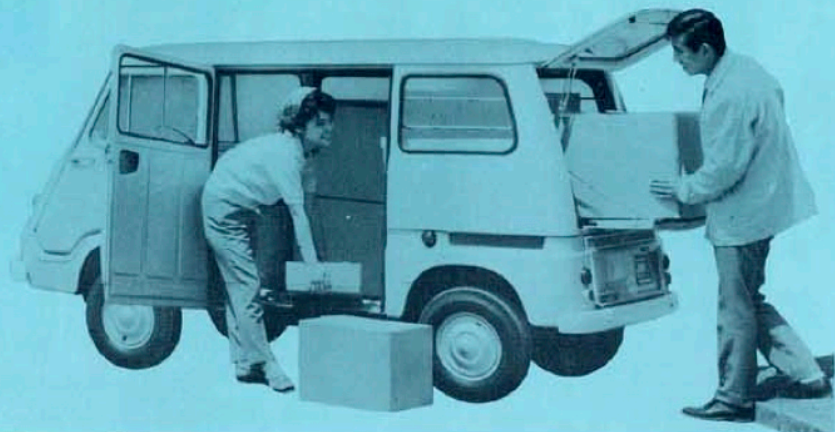
サンバーライトバン(三扉) ¥335,000

軽4種唯一の4扉ライトバン。よこも、うしろも開くライトバン。荷物の大きさ、長さに応じて、どこからでも、容易に、積みおろしができる万能貨客車です。スベアシートをご使用中でも、広いスペースに、うしろから乗に、たくさんの荷物が積みおろしできます。