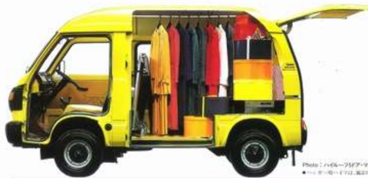
Photo: ハイムワイド・マルチフラット (シグナルイエロー) ●ハイムワイド・マルチフラットは、車内照明にLEDを採用したモデルです。