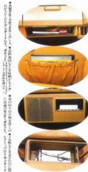
※MPV・N-BOX・ピエー・4WDは別仕様です。詳しくは各ディーラーにお尋ねください。写真は標準仕様です。写真は標準仕様です。写真は標準仕様です。