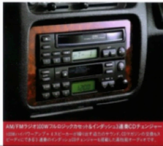
AM/FMラジオ100Wフルロジックカセット&インテックは連続CDチェンジャー。100Wフルパワーアンプ。8スピーカーは専用4チャンネルアンプ。CDチェンジャーは全長44cmでコンパクト。連続再生可能のMP3対応CDチェンジャーも搭載した最新オーディオです。