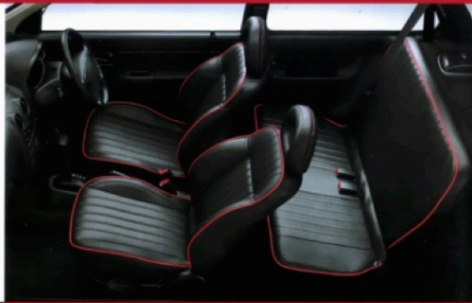
プロテインレザーシート。フロントシートにもバックシートのプロテインレザーを採用。さらさらの質感の肌触り。縫製はシートです。