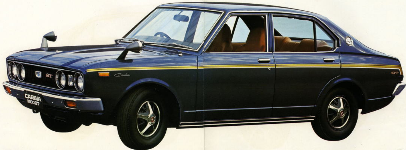
サイドストライプはオプション