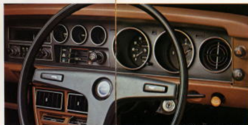
高級イライラインドアフォッガーはオフショウ