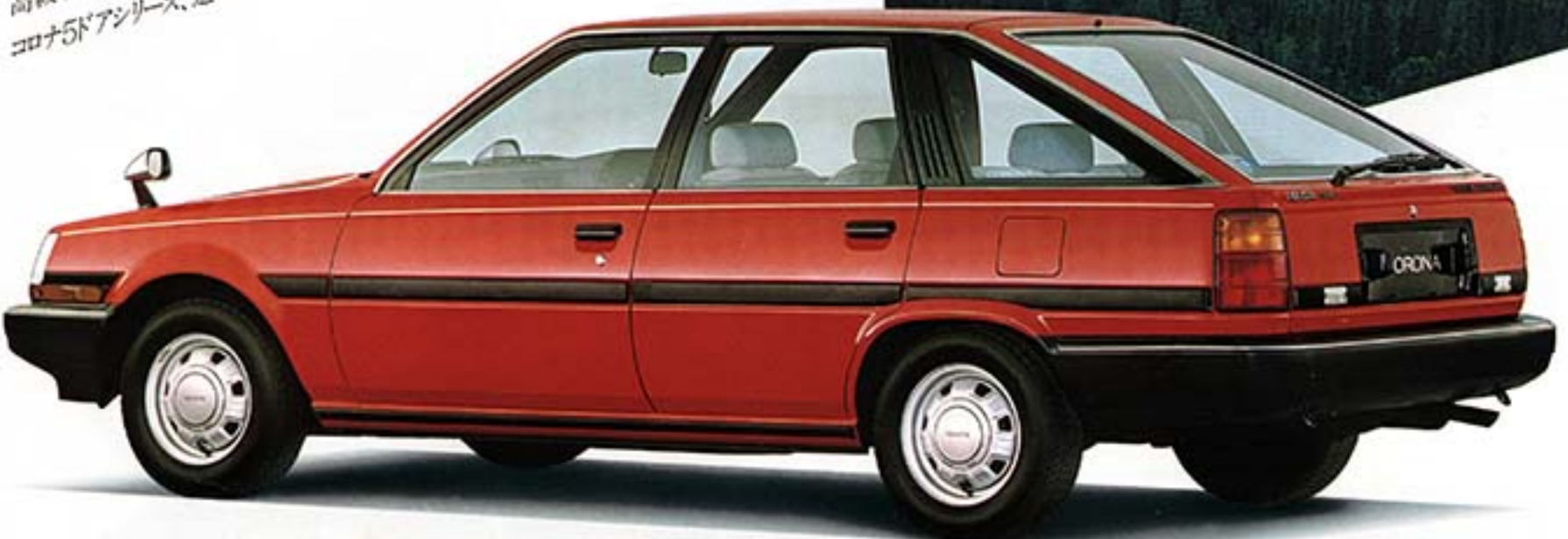
5ドア1800GXエクストラ(ブレーキング・レッド) 175/70SR133チールラジアルタイヤは注文装備。