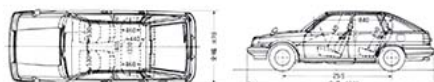
5ドア1800EXサルーン寸法図(単位mm)

●5速マニュアル ●2ウェイ-3速フルオートマチック ■AM/FMマルチ2スピーカーラジオ ●電動リモコンミラー ●衝撃吸収式ウレタンバンパー ホイールハウスまでまわり込んだ大型、フロント部はエアカブフラップ一体の空力デザイン ●ドアサッシュブラックアウト ●リヤウインドウワイパー&ウォッシャー ●運転席ドアポケット ●ラック&ピニオン回転数感知型パワーステアリング ●165SR13スチールラジアルタイヤ