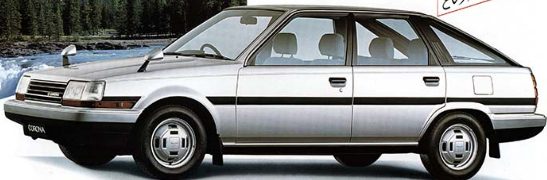
5ドア1800E Xサルーン(クォーターシルバース)17L 70SR133キールラジアルタイヤ、マッドガードは注文装備。