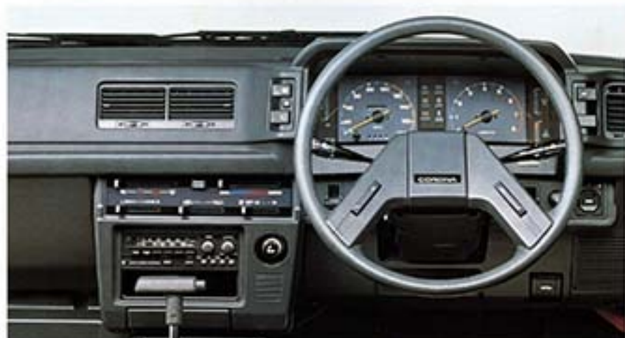
コンソールボックス付エアコン、ワンタッチ式パワーウィンドウは注文装備。