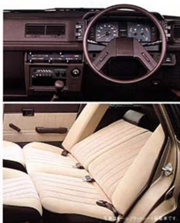
S7A18000X (キャメル・ベージュM) 写真は、オールフラットシート装着車ではありません。(リヤヘッドレストは装備されません。)