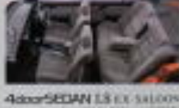
4door SEDAN LS EX SALOON