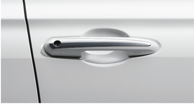
アウトサイドドアハンドル (メッキ)