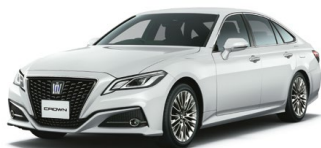
WHITE PEARL CS.<062>