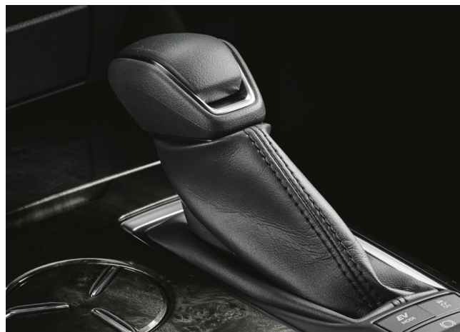
Photo (上 / 中央) : 特別仕様車HYBRID 2.5 S "Elegance Style II" [ベース車両はS (2.5Lハイブリッド車)]。ボディカラーのプレシャスブラックパール(219)はメーカーオプション。内装色はブラック。 ■写真は機能説明のために各ランプを点灯したものです。実際の走行状態を示すものではありません。 ■画面はハメ込み合成です。