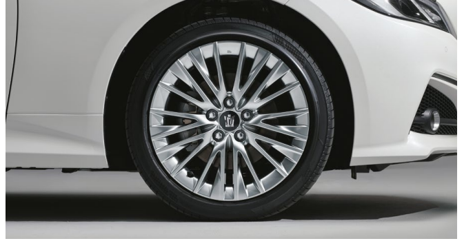
18インチノイズリダクションアルミホイール (ハイパークロームメタリック塗装) & センターオーナメント