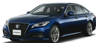
DK. BLUE MC.<8S6>