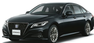
PRECIOUS BLACK PEARL<219>