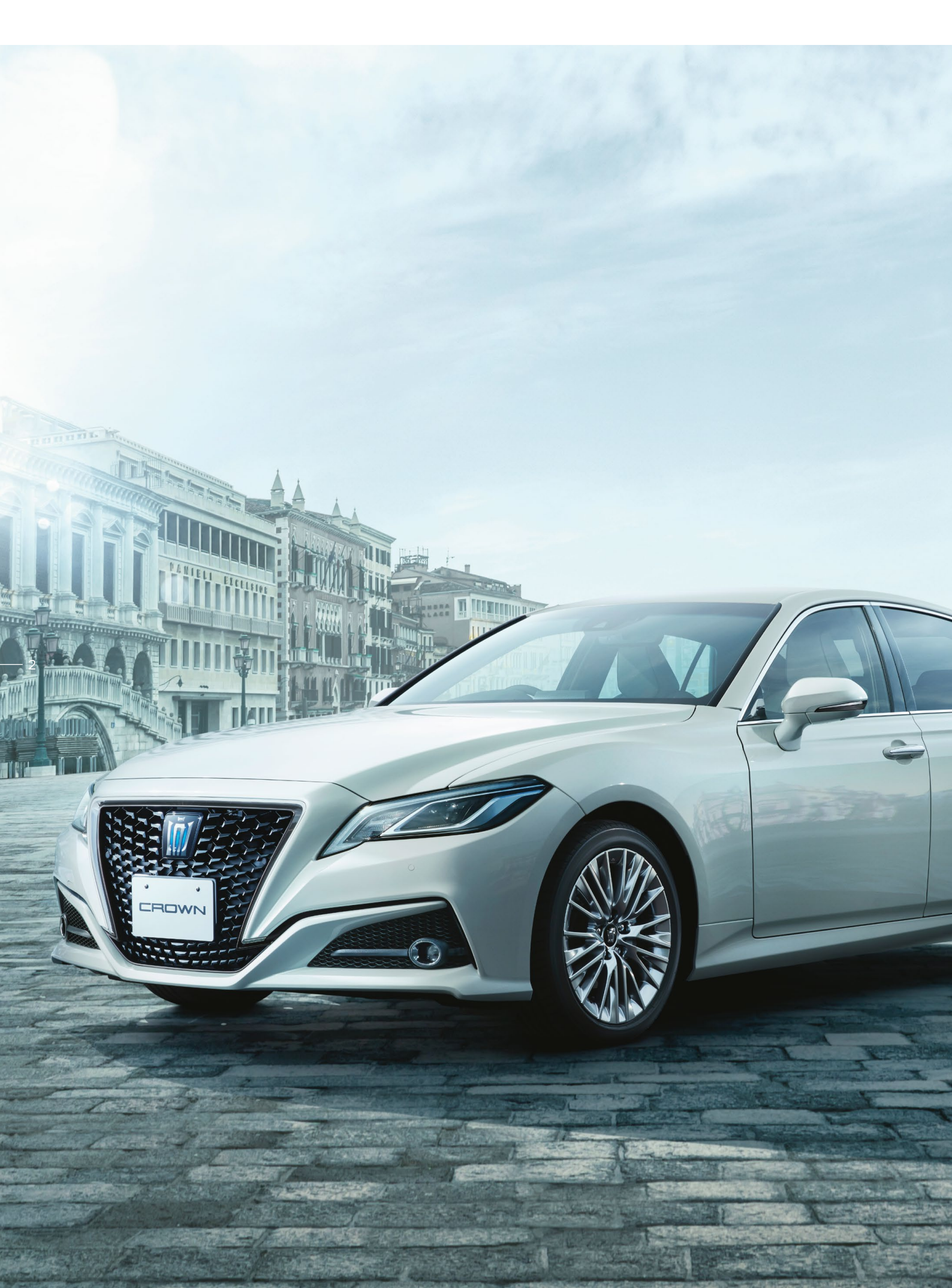
Photo : 特別仕様車HYBRID 2.5 S "Elegance Style II" [ベース車両はS (2.5Lハイブリッド車)]。ボディカラーのホワイトパールクリスタルシャイン (062) はメーカーオプション。 内装色のライトグレーは設定色 (ご注文時に指定が必要です。指定がない場合はブラックになります)。 ■写真は合成です。