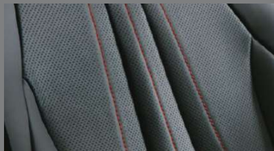
本革シート表皮(レッドステッチ付) [メーカーパッケージオプション(レザーシートパッケージ)]