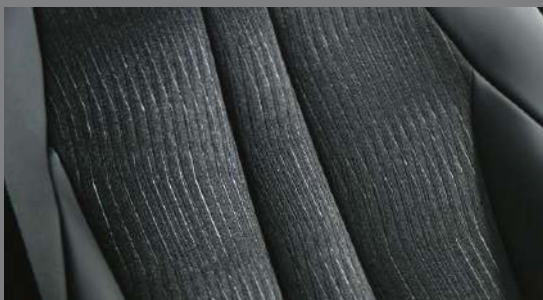
ファブリック+合成皮革シート表皮