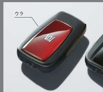
専用スマートキー(2個) (専用スモーク調金属加飾/専用色)