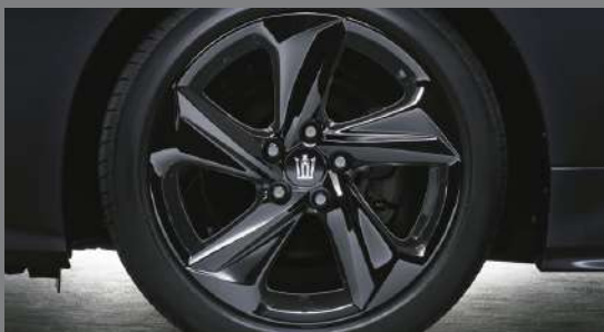
専用18インチアルミホイール (ブラックパターニング塗装/RS仕様専用)&センターオーナメント