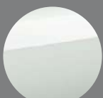
ホワイトパール クリスタルシャイン(O62)