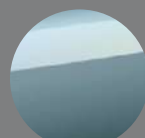
プレシャス ガレナ(1K5)