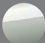
プレシャス シルバー(1J6)