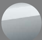
シルバー メタリック(1F7)