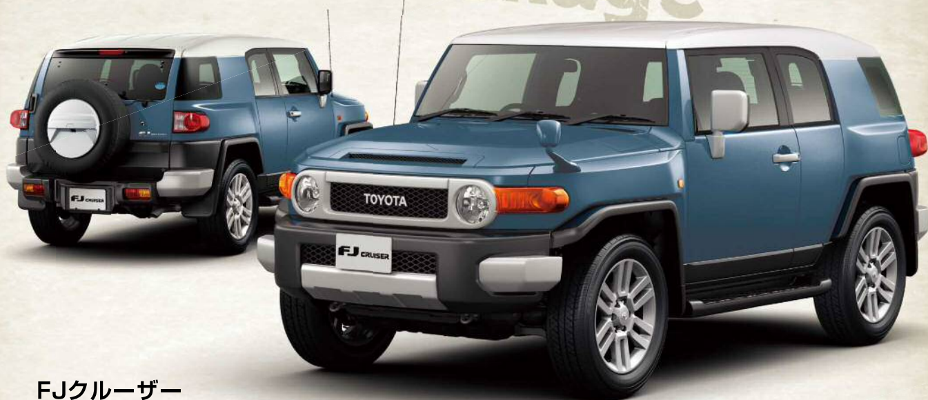
FJクルーザー "カラーパッケージ"