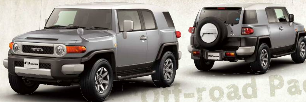
FJクルーザー “オフロード パッケージ”