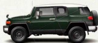
ツートーン ダークグリーン<2KD>