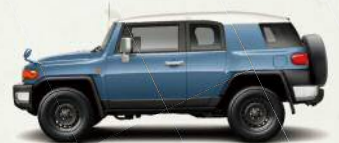
ツートーン スモーキーブルー<2LS>