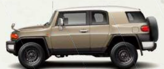
ツートーン ベージュ<2KP>