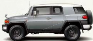
ツートーン セメントグレーメタリック<2KY>