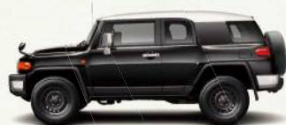
ツートーン ブラック<2KC>