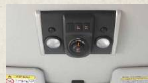
●写真はイメージです。