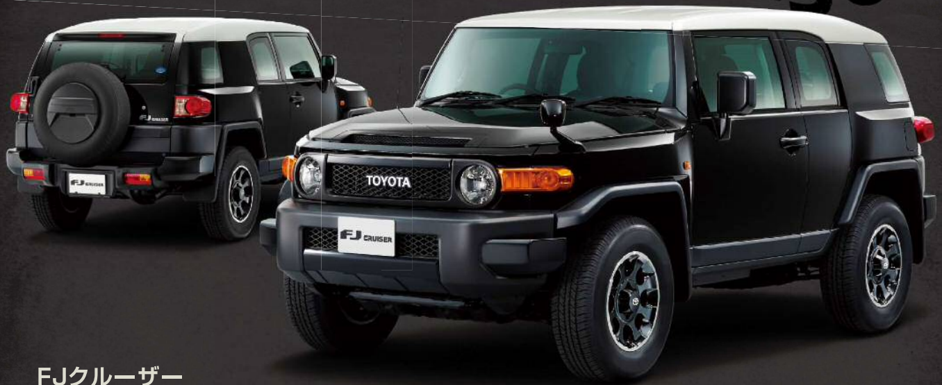
FJクルーザー “ブラックカラーパッケージ”