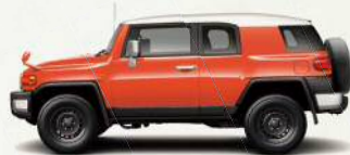
ツートーン オレンジ<2LF>