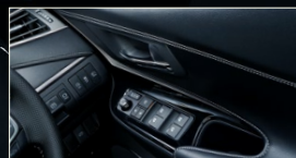
ドアトリム(ダークシルバー塗装ガーニッシュ+シルバーステッチ) / ドアスイッチベース(ピアノブラック加飾)