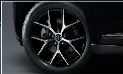
専用18インチアルミホイール(切削光輝+ブラック塗装)