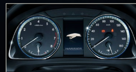
オプティロンメーター(ピアノブラック加飾)