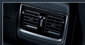
後席エアコン吹き出し口(ダークシルバー塗装)