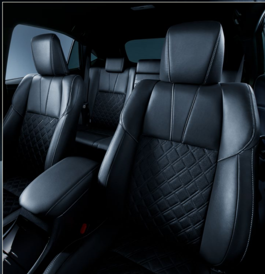
ファブリック+合成皮革シート(シルバーステッチ)