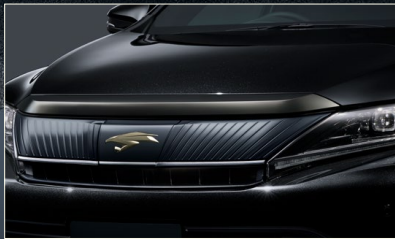
フードモール(漆黑メッキ)