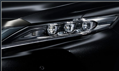
ヘッドランプエクステンション(スモーク調メッキ加飾)