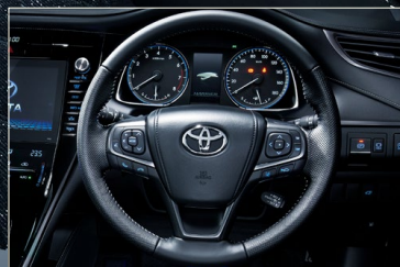
本革巻き3本スポークステアリングホイール(ティンブラ加工×シルバーステッチ)+ステアリングスイッチベゼル(ダークシルバー塗装)