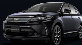
スパークリングブラック