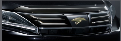
フロントグリルガーニッシュ(漆黑メッキ)

MODELLISTA モデリスタパーツ(販売店装着オプション) (株)トヨタカスタマイジング&ディベロップメントの取り扱い商品です。