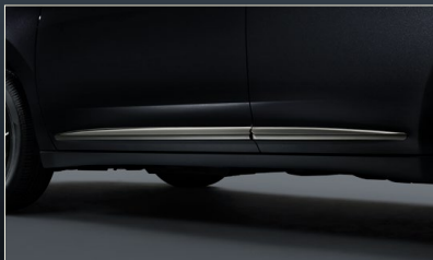
サイドプロテクションモール(漆黑メッキ)