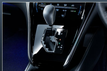
本革巻きシフトノブ(ティンブラ加工×シルバーステッチ)/シフトパネル(ピアノブラック加飾)