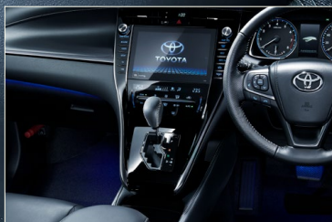
センタークラスターパネルガーニッシュ(サイド部:ダークシルバー塗装)/ニーパッド(シルバーステッチ)