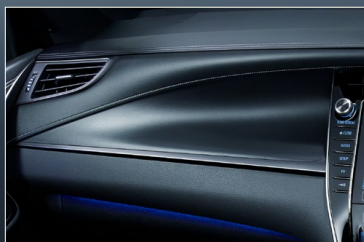
インストルメントパネル(ダークシルバー塗装ガーニッシュ+シルバーステッチ)