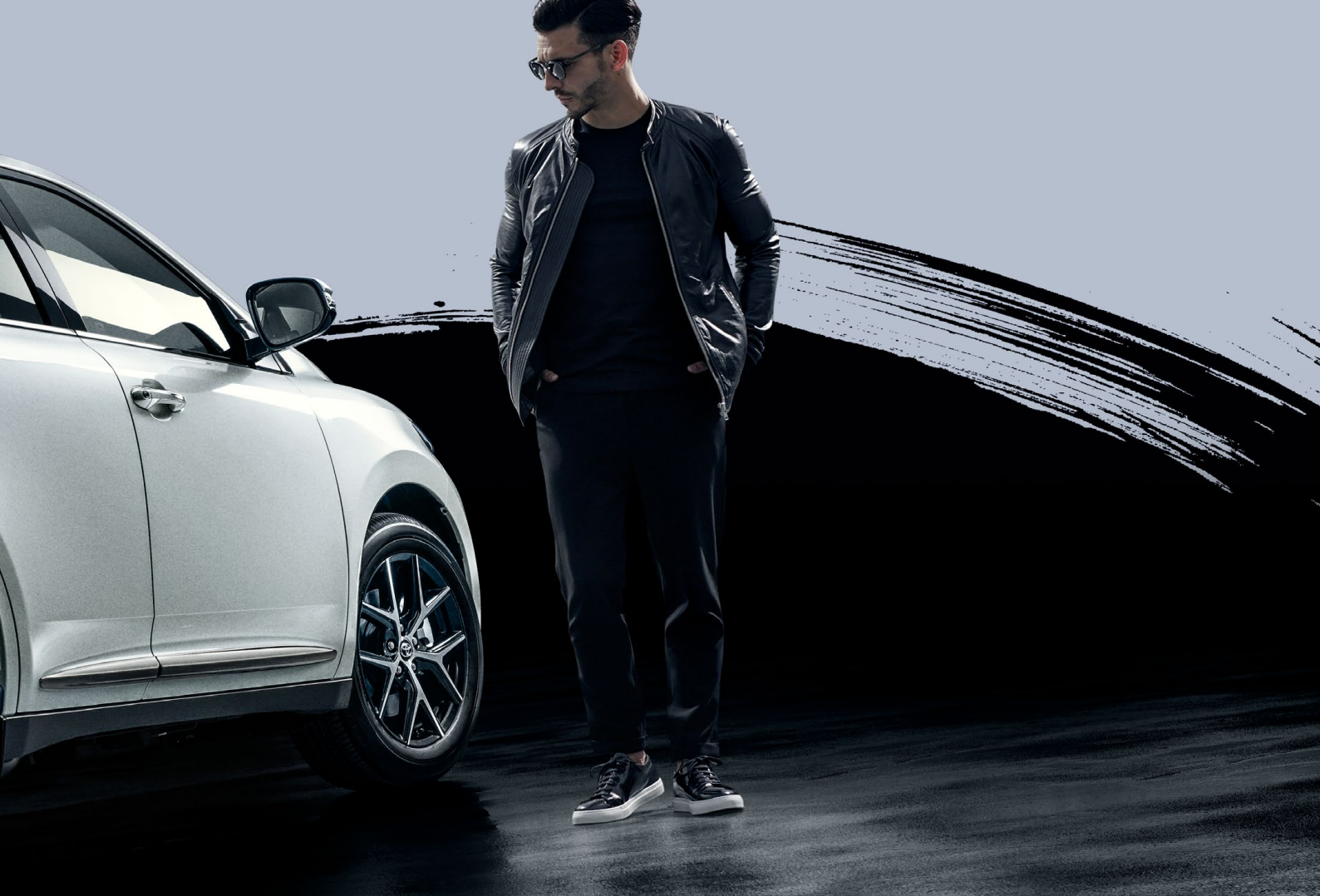
Photo:特別仕様車 PREMIUM“Style NOIR” (ガソリン2WD車) [ベース車両はPREMIUM (ガソリン2WD車)]. ボディカラーのホワイトパールクリスタルシャイン(070)はメーカーオプション。