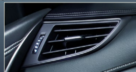
サイドレジスターベゼル(ダークシルバー塗装)