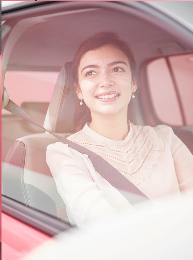
SPECIAL EQUIPMENT | 合成皮革+ファブリックシート表皮

お気に入りの空間で、 笑ったり、驚いたり、キュンとしたり。 前へ、遠くへ、走るほど、きっと心も動くはず。 かわいいは、毎日のエンジンです。