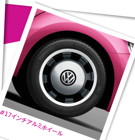
#17インチアルミホイール