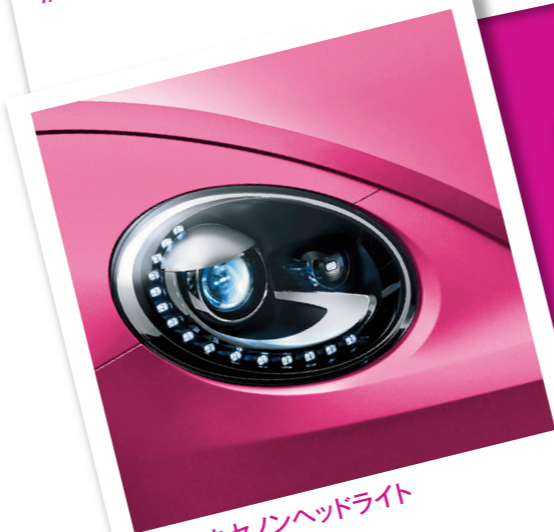
#バイキセノンヘッドライト