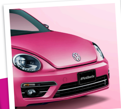
#専用ボディカラー 「フレッシュクシアメタリック」