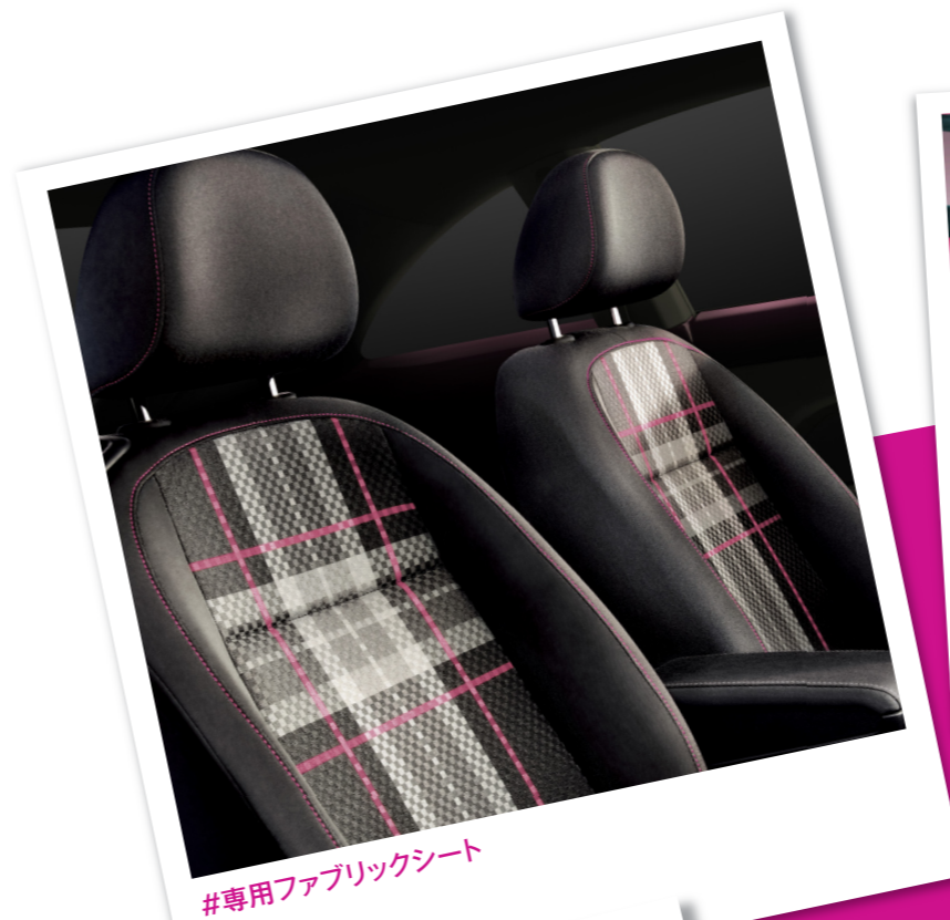
#専用ファブリックシート

Pinkに誰もが目を奪われる、誰かに話したくなる。街の噂になりそうな鮮やかな存在感をまとって、日本に300台の特別限定車#PinkBeetle登場。この一台のためだけに用意された、花の名からイメージした専用ボディカラー「フレッシュクシアメタリック」の華やかな装い。室内の専用インテリアなど、細部まで目にも鮮やかなカラーコーディネートが息づいています。大人だからこそ、自分らしく着こなす、個性を表現できる、街の主演#PinkBeetle。さあ、あなただけのカラーを咲かせましょう。