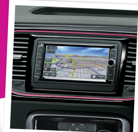
#Volkswagen純正ナビゲーションシステム「716SDCW」