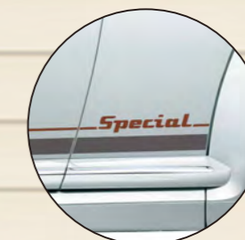
文字: ブラウン アンダーライン: グレー