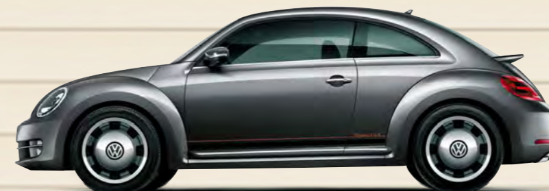
プラチナムグレーメタリック(2R) 限定 200 台