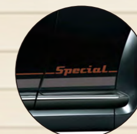
文字: ブラウン アンダーライン: グレー