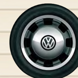
ホイール: "Circle Black"