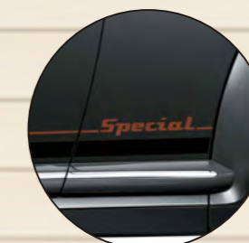
文字: ブラウン アンダーライン: ブラック