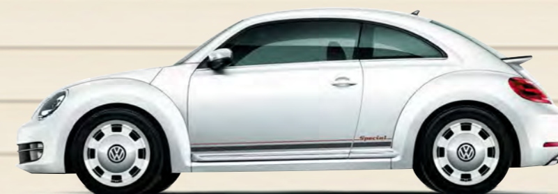
ピュアホワイト(0Q) 限定 400 台