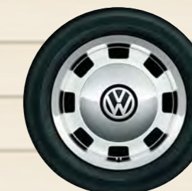
ホイール: "Circle White"