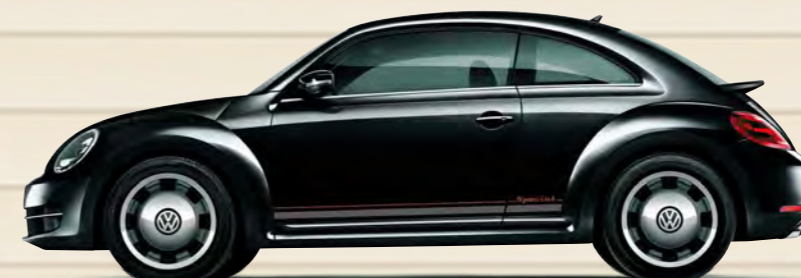
ディープブラックパールエフェクト(2T) 限定 200 台