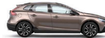
ロウカッパーメタリック (708)