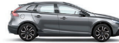
オスミウムグレーメタリック (714)