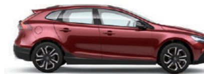
フラメンコレッドメタリック (702)