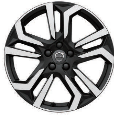
"Metallah" 7.5×18インチ ダイヤモンドカット/ブラック T5 AWD Momentum, T5 AWD Summum 標準装備/ D4 Momentum, D4 Summum オプション設定