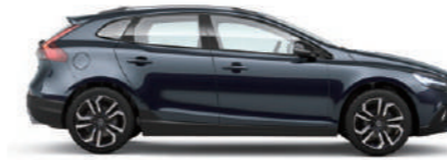
デニムブルーメタリック (723)