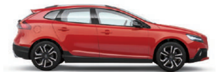
パッションレッド (612)