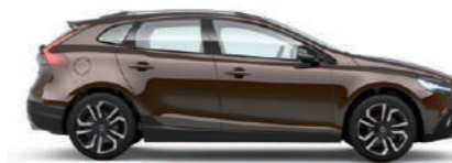
リッチジャバメタリック (712)