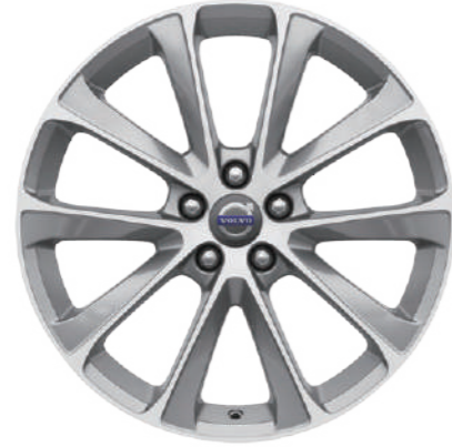
"Damara" 7.5J×19インチ ダイヤモンドカット/ライトグレー T5 AWD Momentum, T5 AWD Summum オプション設定

ボディ前後のスキッドプレート、マットシルバー仕上げのサイドスカッププレート、大径ホイール、ブラックの樹脂製パネルなどの特徴的なデザイン要素が、エレガントでありながらもタフなCross Countryのルックスを形作ります。パレットに並べられた沢山の外装色は、スウェーデンの大自然からインスピレーションを得た、独自性、品質感、カリスマ性を感じさせるものばかりです。アルミホイールは専用デザインを数多く揃えました。あなたのV40 Cross Countryのための、特別な一本をお選びください。