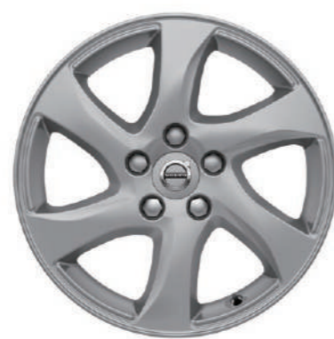
"Geminus" 7.0J×16インチ シルバーストーン T3&D4 Kinetic 標準装備