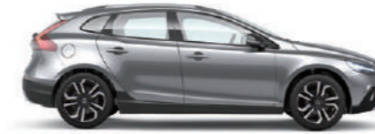
エレクトロリクスシルバーメタリック (477)