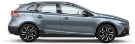
マッセルブルーメタリック (721)