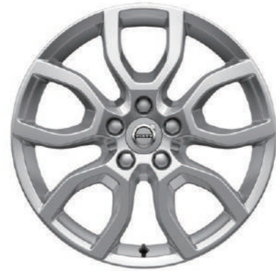
"Keid" 7.0J×17インチ シルバー D4 Summum, D4 Momentum 標準装備/ T3&D4 Kinetic オプション設定