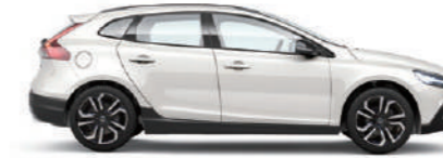
クリスタルホワイトパール (707)