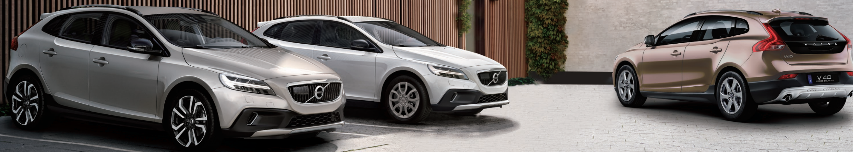
Volvo V40 Cross Country Kinetic