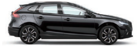
オニクスブラックメタリック (717)