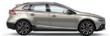
ルミナスサンドメタリック (719)